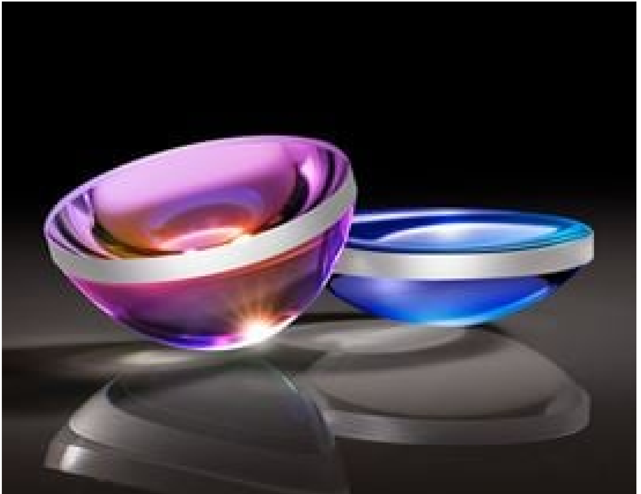
TECHSPEC UV Fused Silica Aspheric Lenses