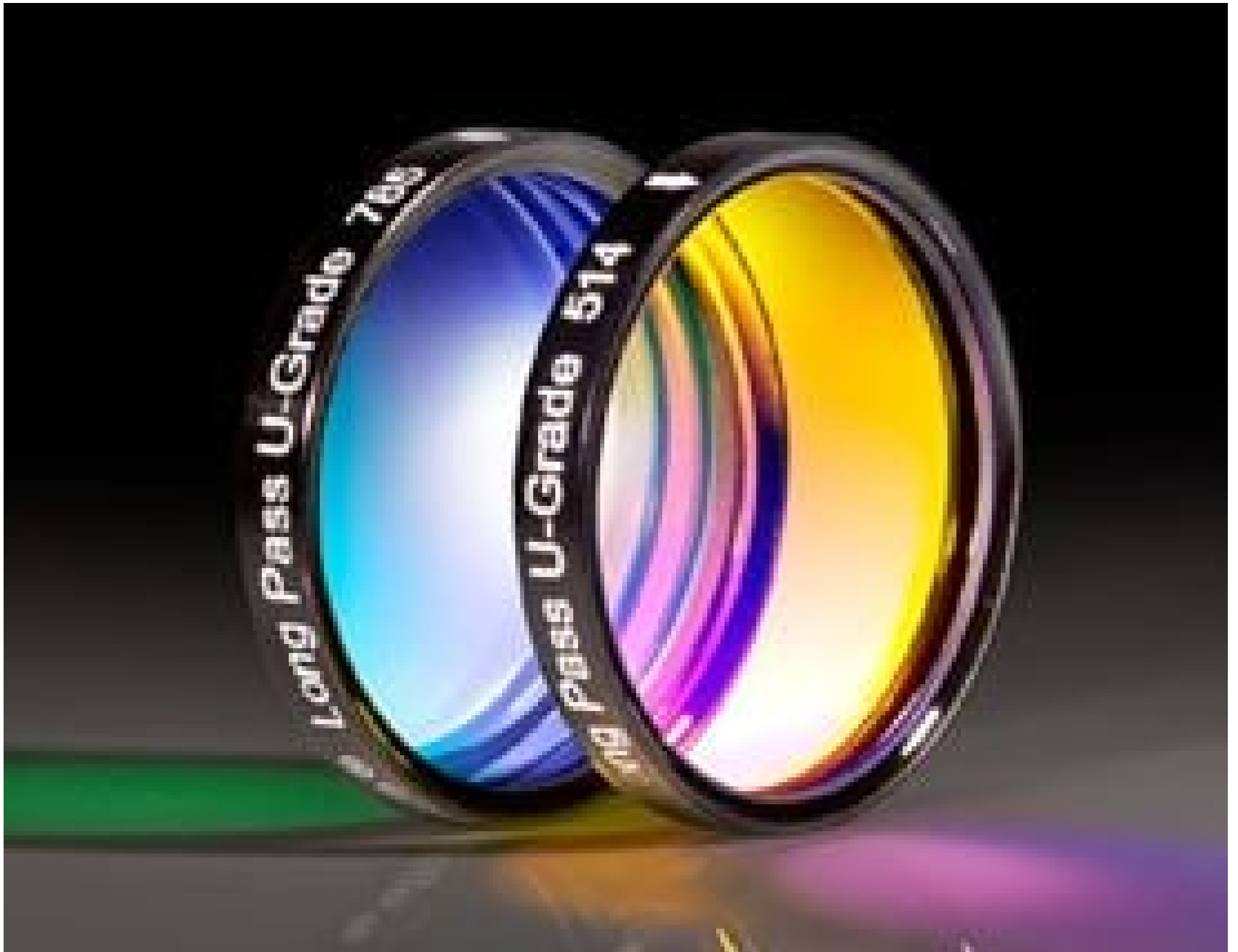
Laser Line Longpass Filters