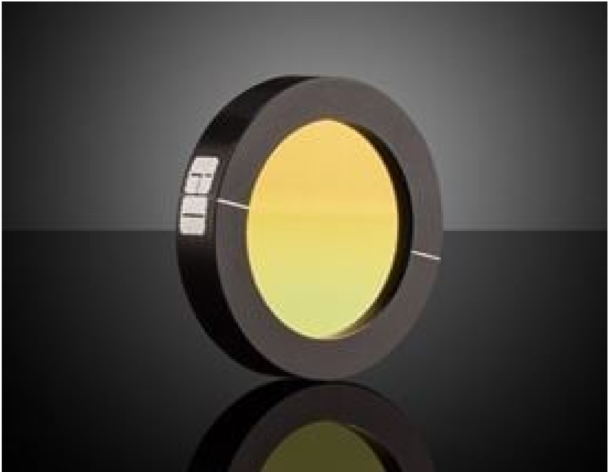
25mm Dia. BaF 2 IR Holographic Wire Grid Polarizer, #62-770