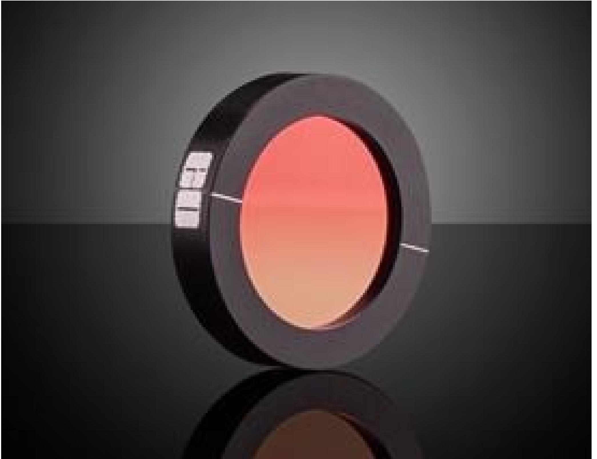
25mm Dia. Ge, IR Holographic Wire Grid Polarizer, #62-776