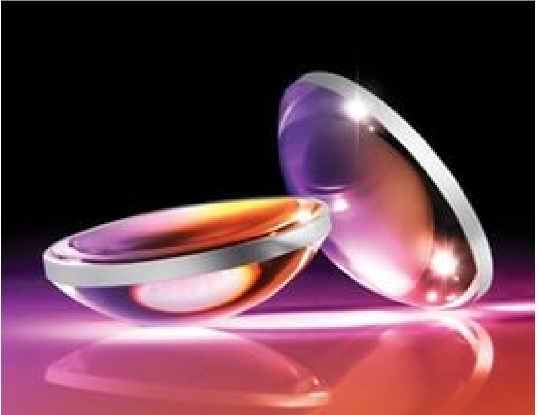
Hyperbolic Aspheric Lenses