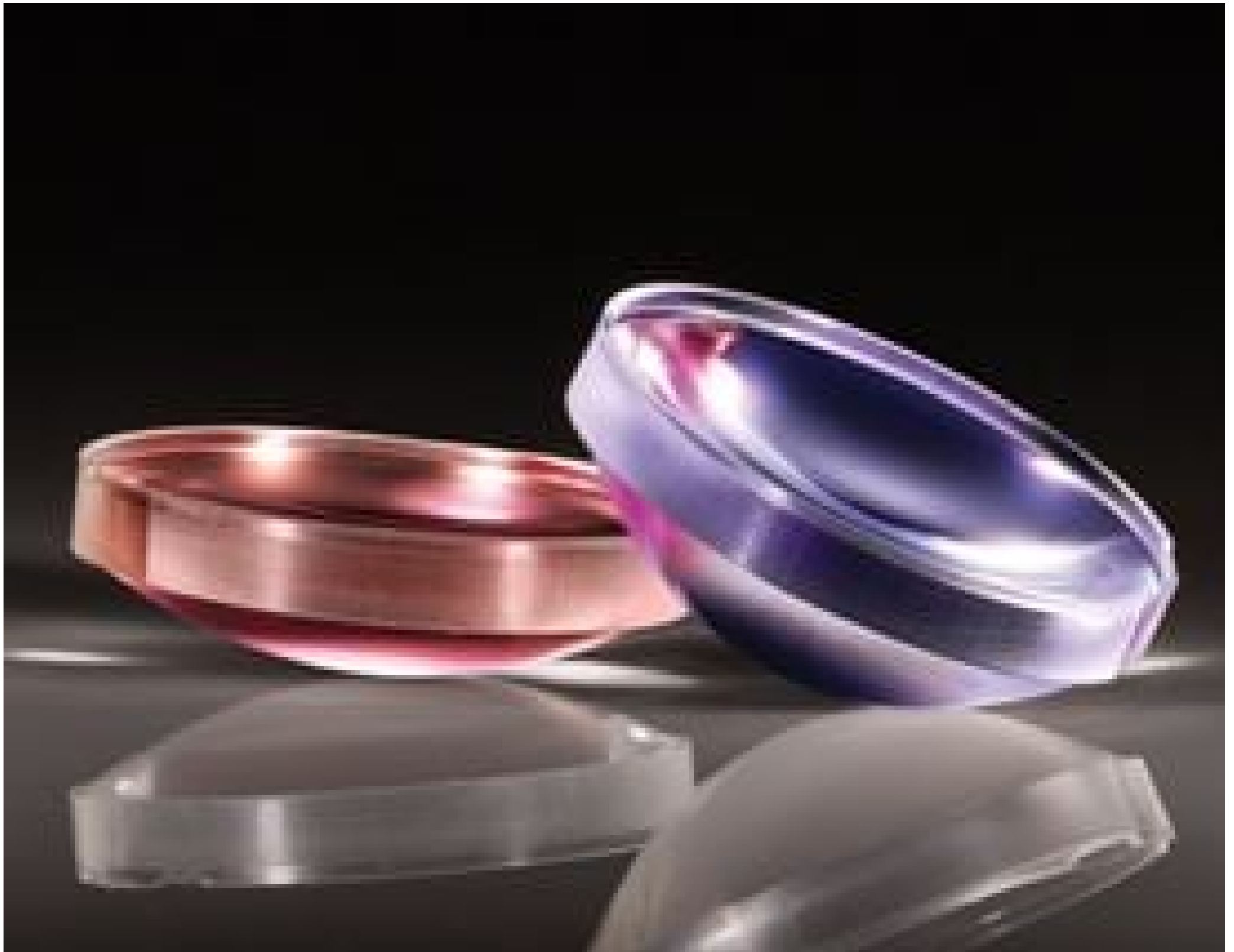
TECHSPEC® Plastic Hybrid Aspheric Lenses