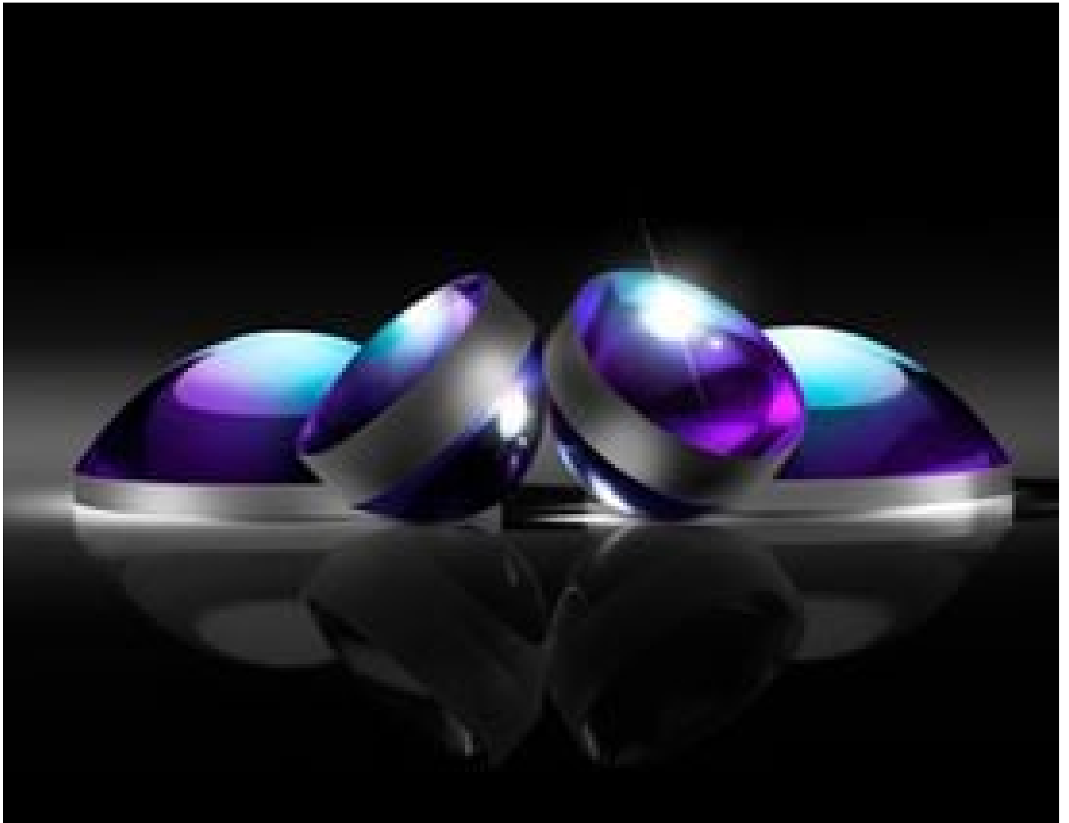
TECHSPEC® Calcium Fluoride (CaF 2 ) Aspheric Lenses