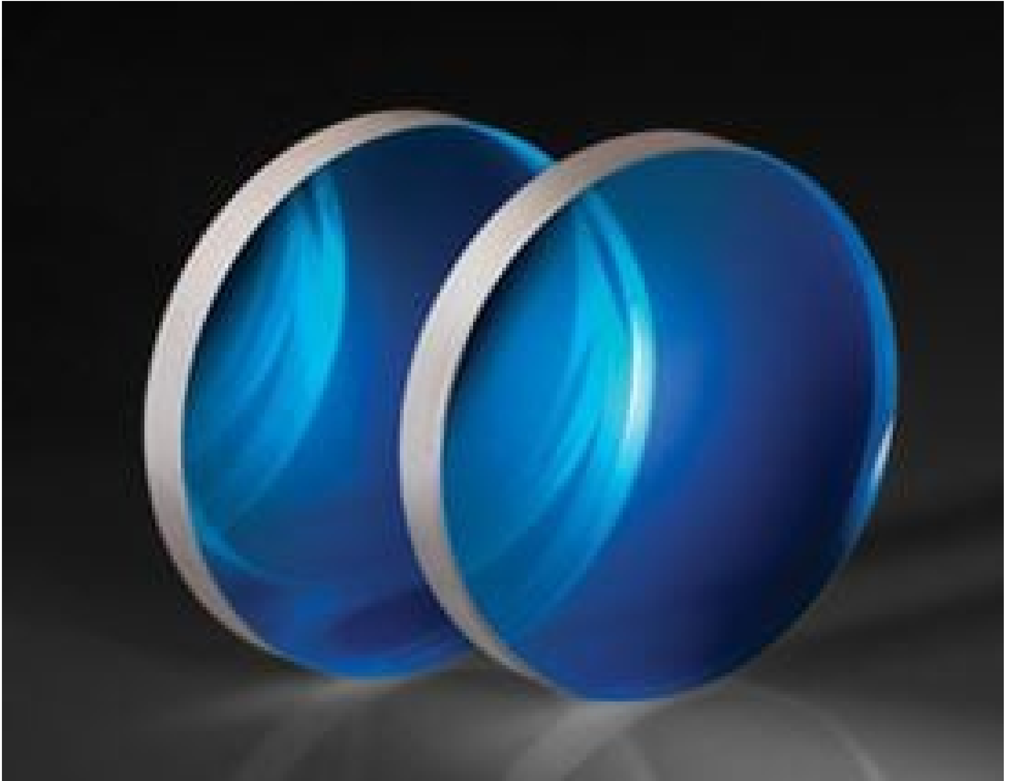
TECHSPEC® M10 Plate Beamsplitters