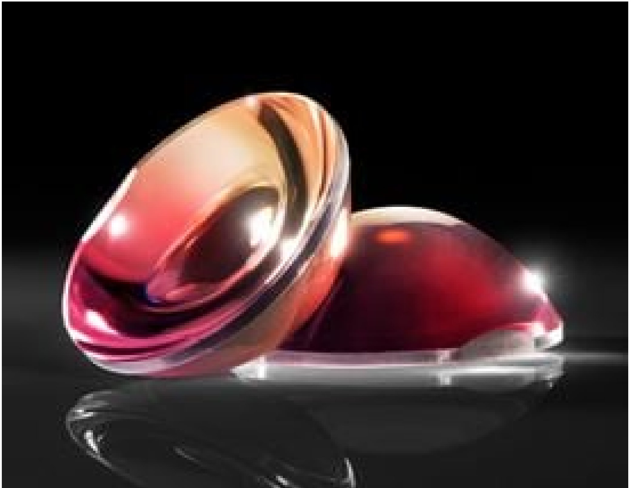
TECHSPEC® Plastic Aspheric Lenses