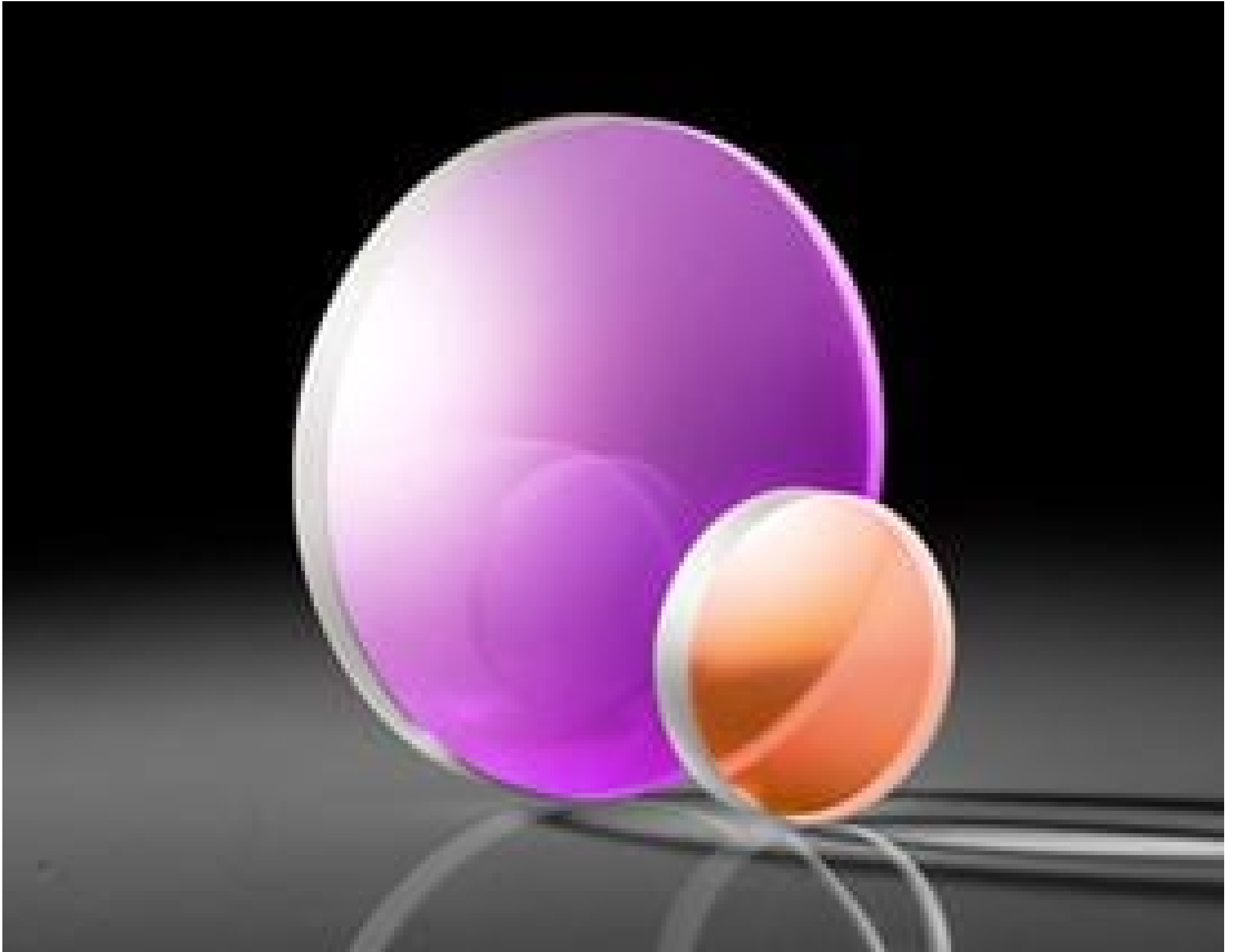
TECHSPEC Laser Grade PCXLenses