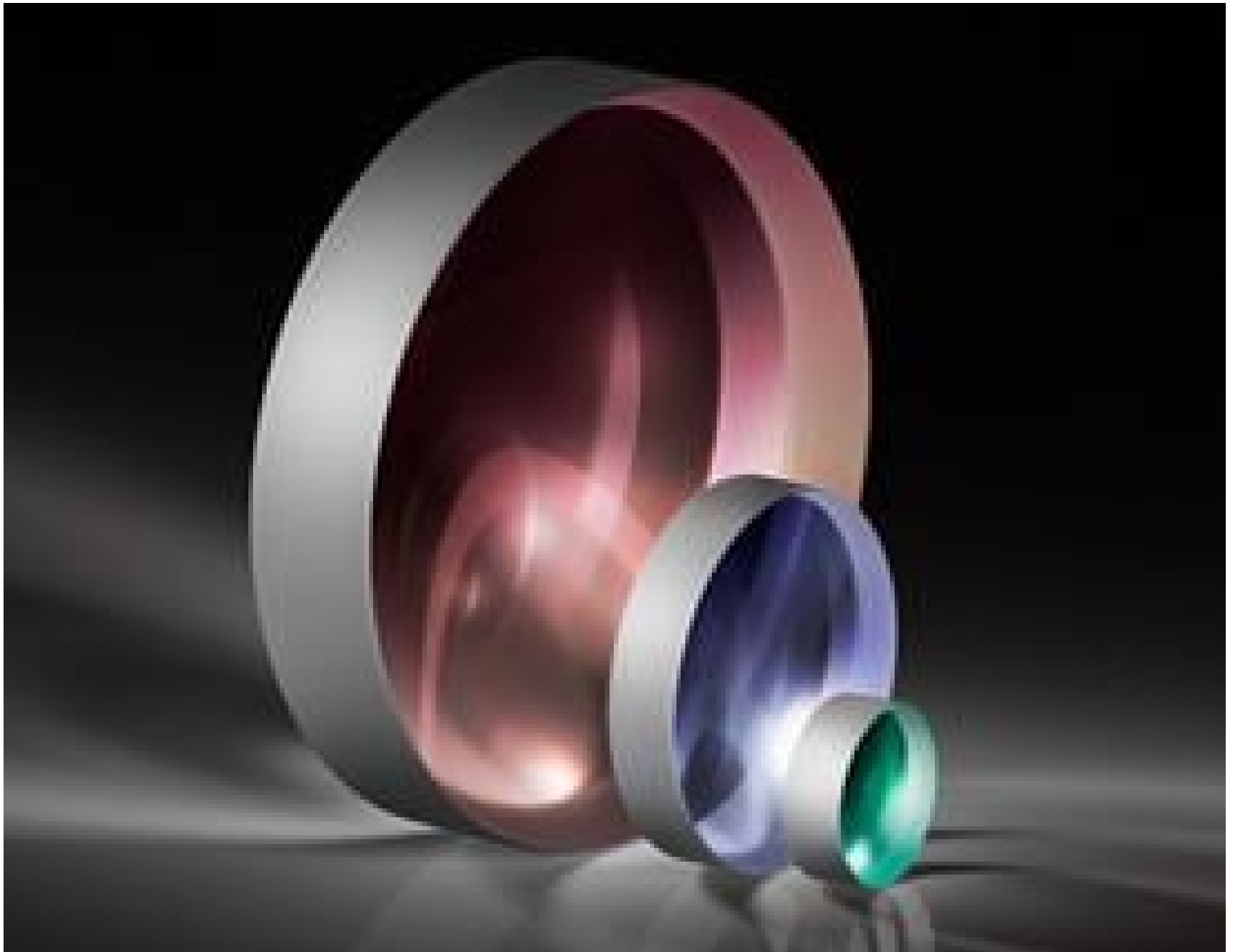
TECHSPEC VIS-NIR Coated Plano-Concave (PCV) Lenses