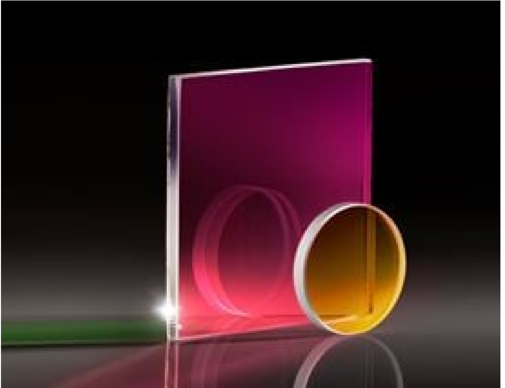
Extended Hot Mirrors