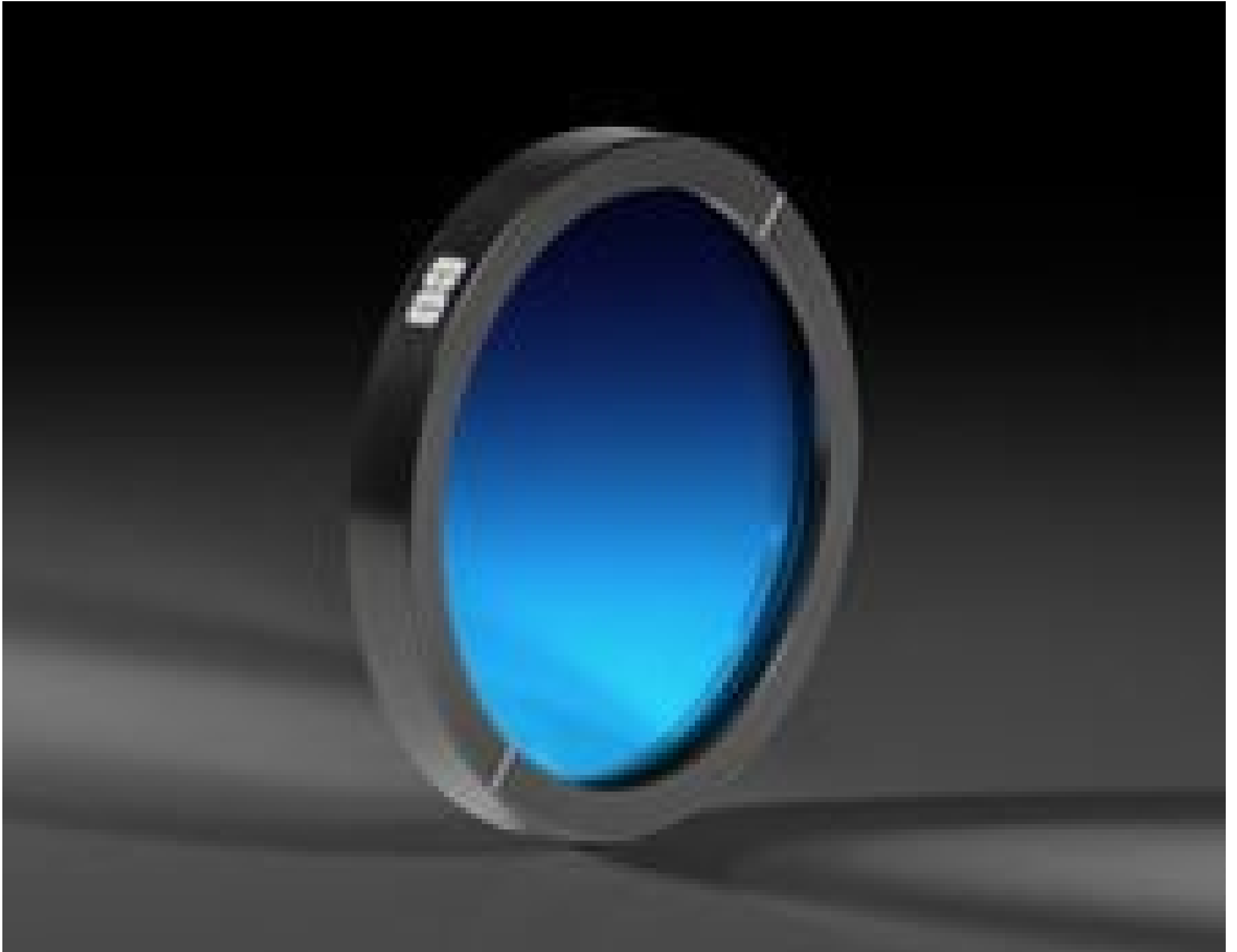
Mounted Ultra Broadband Wire Grid Linear Polarizer