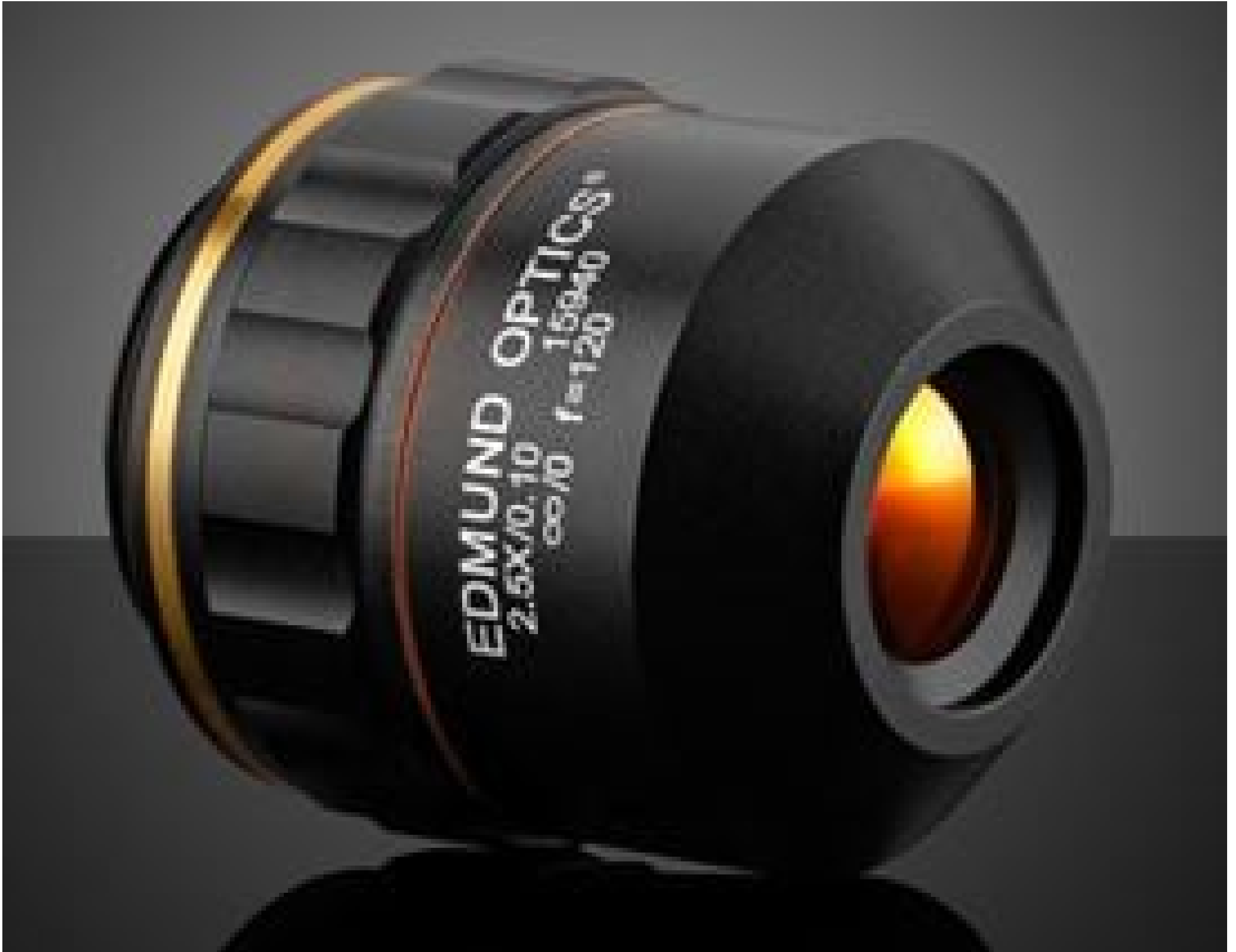
2.5X 120i Plan APO Infinity Corrected Objectives