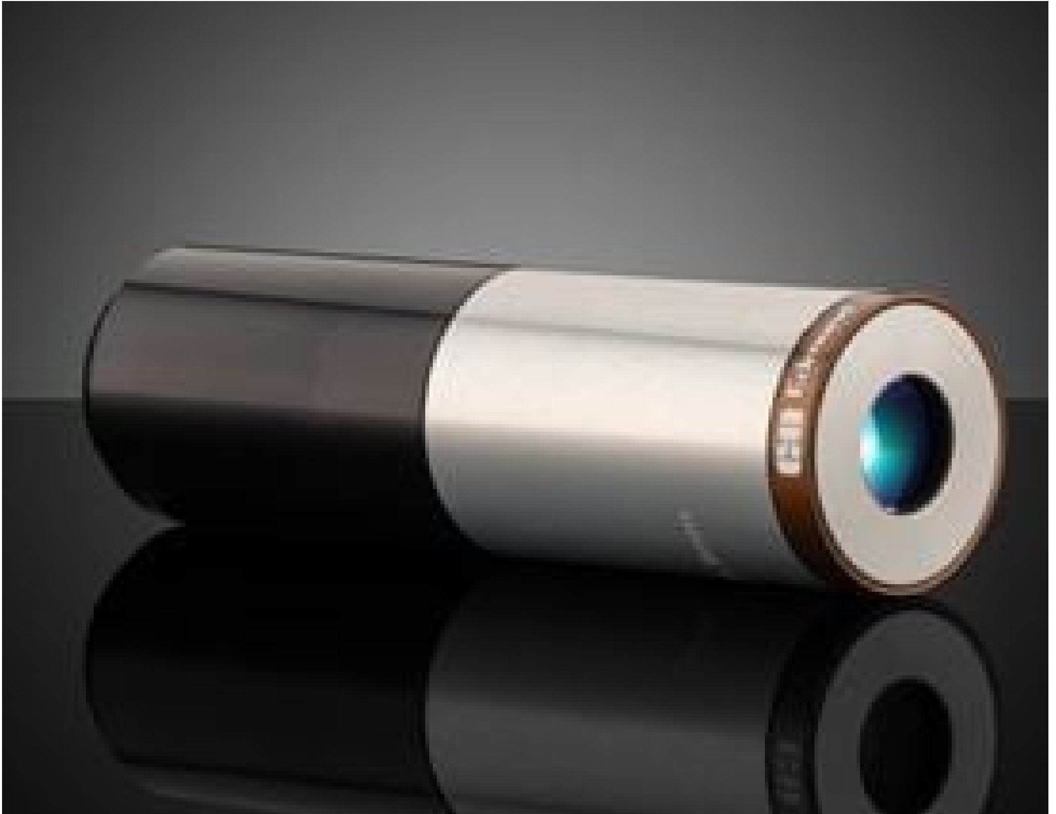
#88-352: 2X Cf Objective