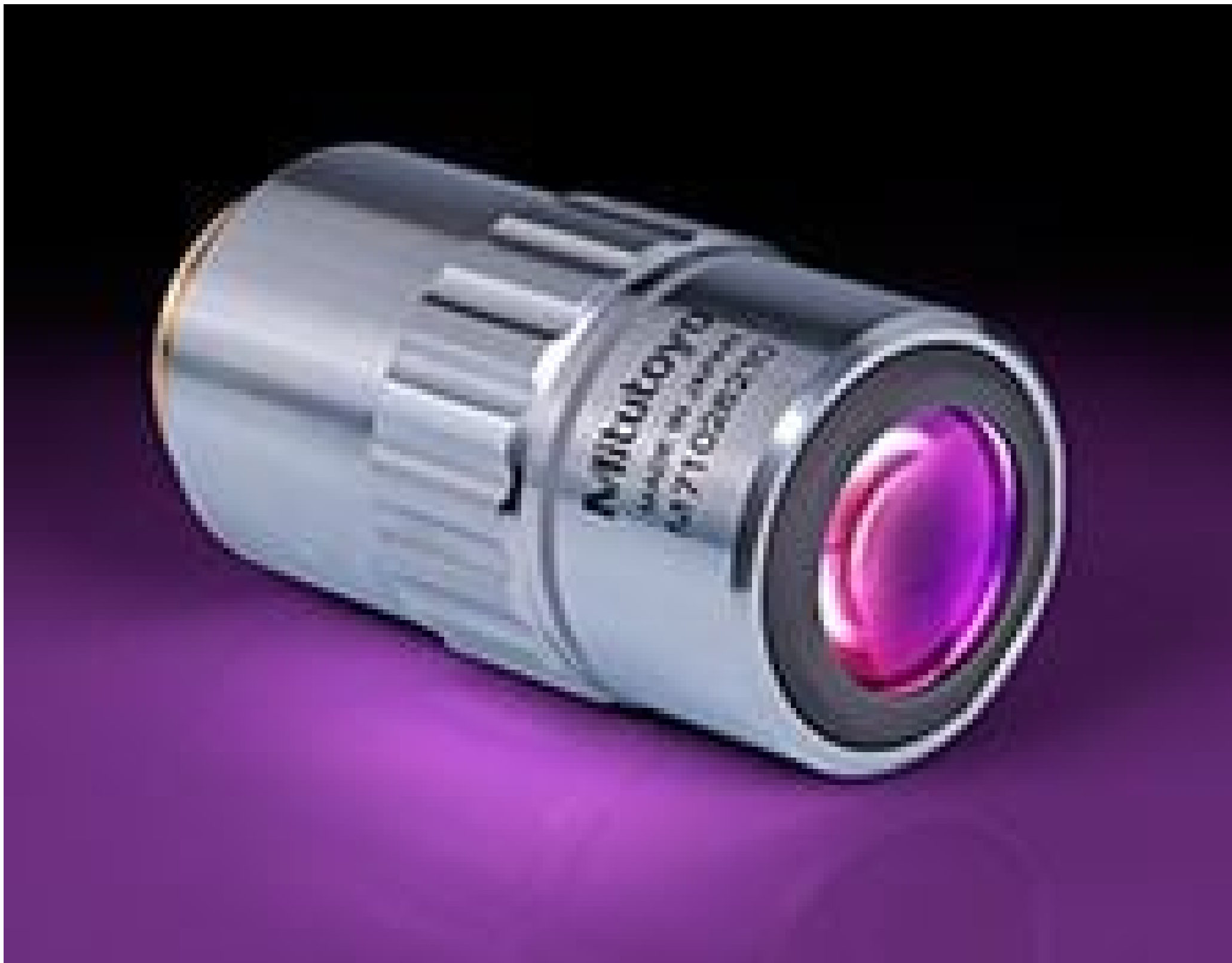
2X Mitutoyo Plan Apo Infinity Corrected Long WD Objective, #46-142