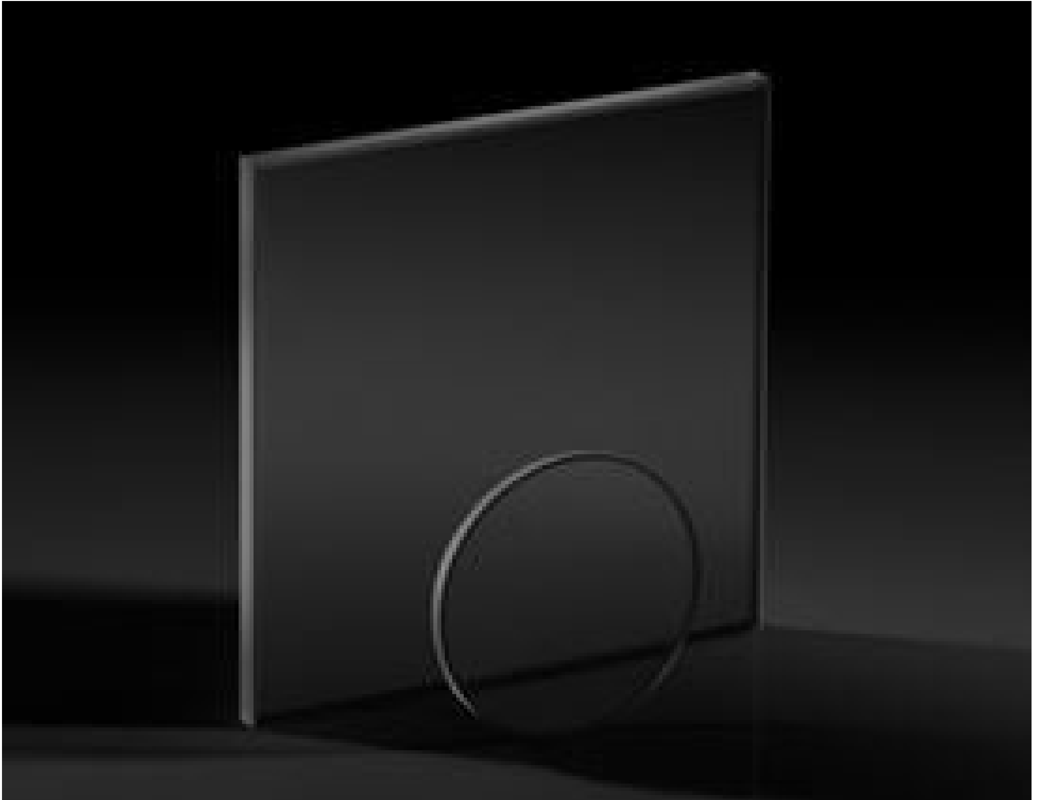
Precision Absorptive Neutral Density (ND) Filters