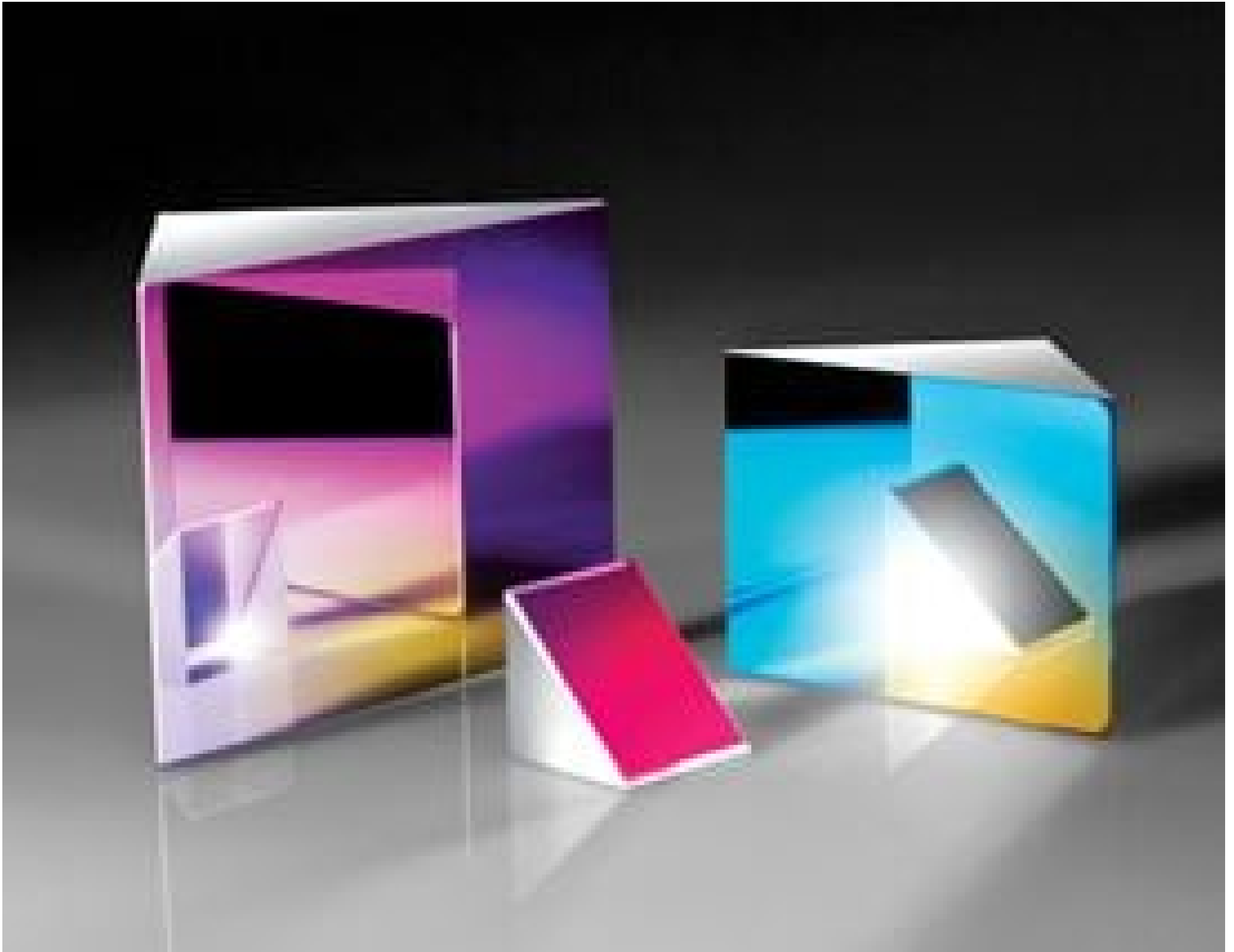
Broadband Dielectric Coated Right Angle Mirrors