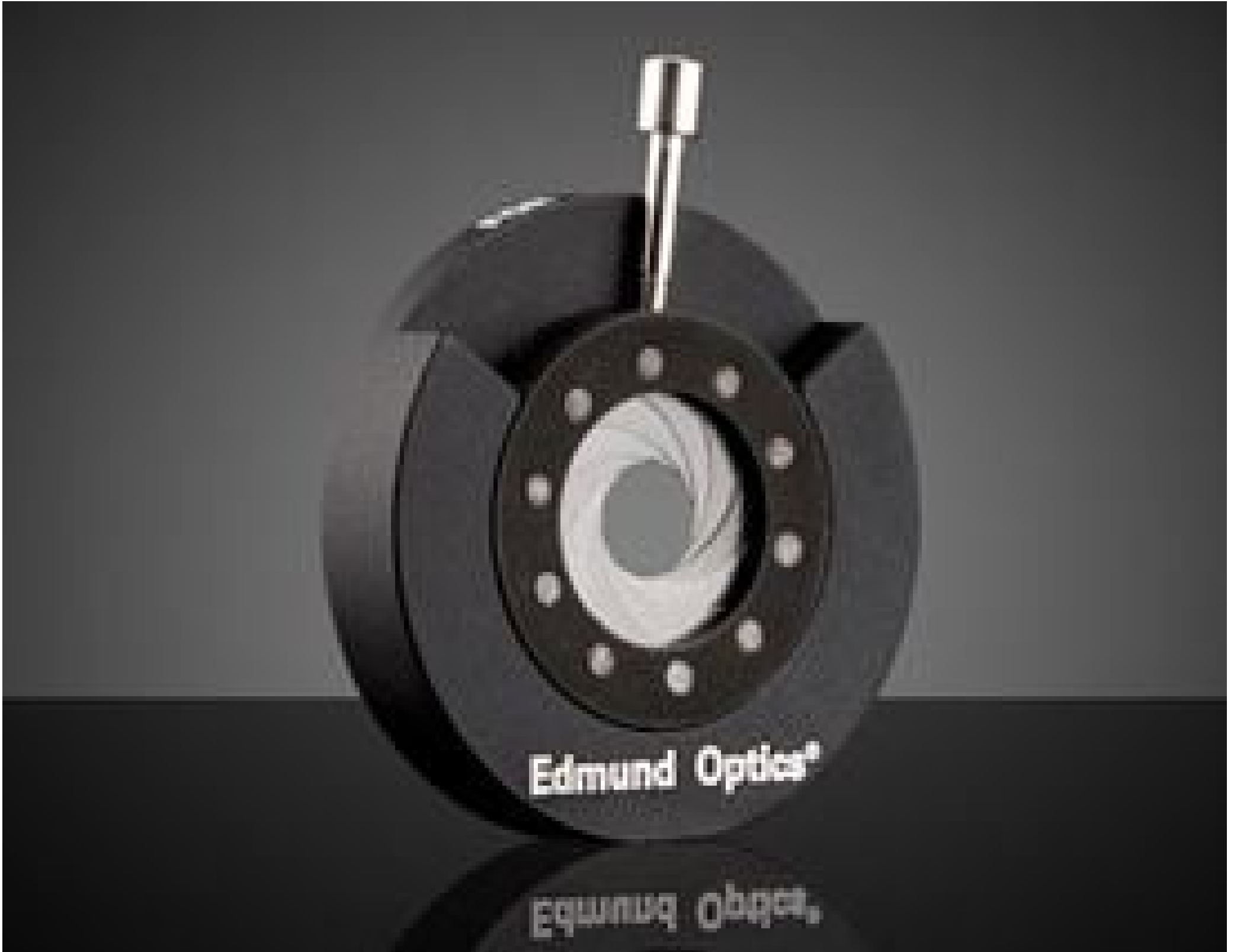
30.8mm Outer Diameter, Mounted Iris Diaphragm, #53-914