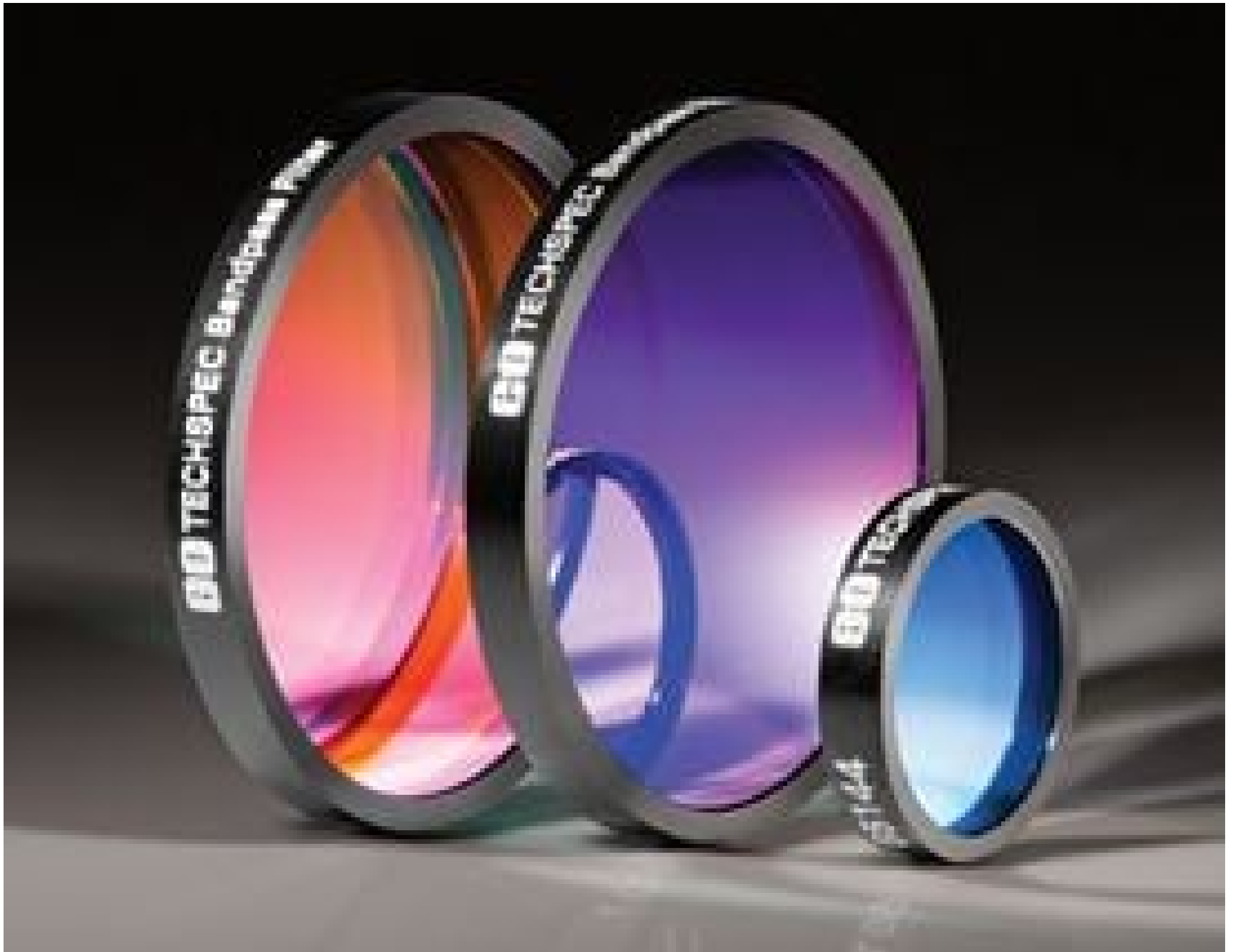
TECHSPEC Hard Coated OD 4.0 5nm Bandpass Filters