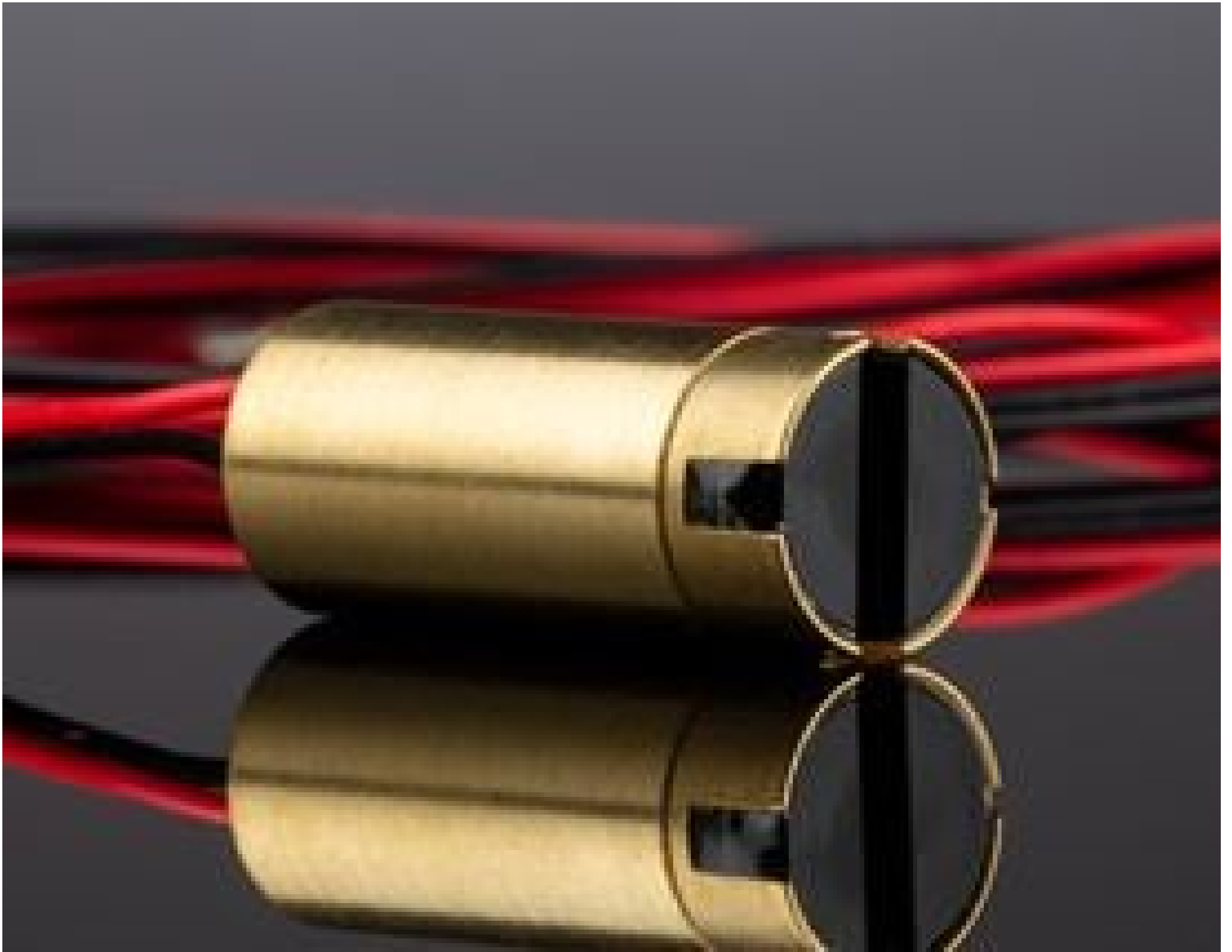
Coherent® Micro VLM™ Laser Diode - Line Option