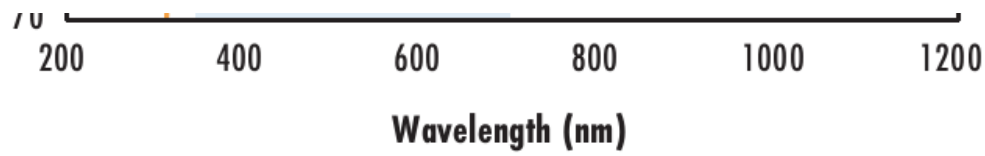
N-BK7 with VIS-NIR Coating Typical Transmission