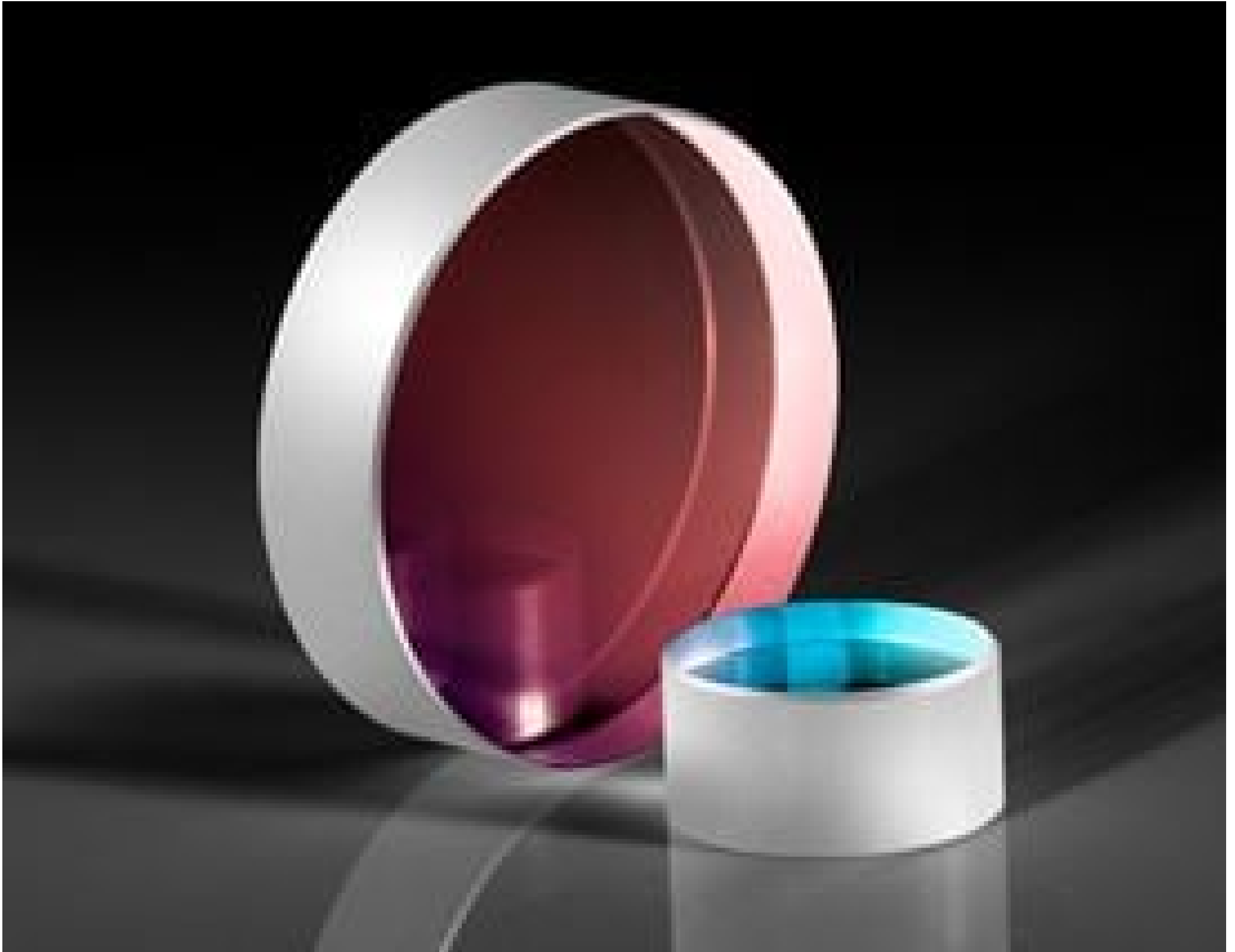
\lambda/10 Ultra-Low Reflectivity Windows