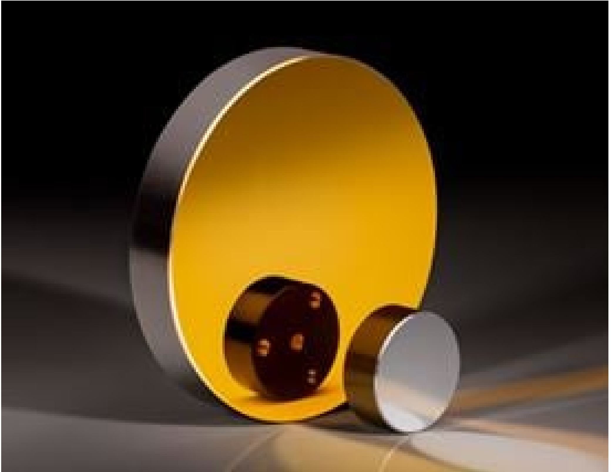
Metal Substrate Mirrors