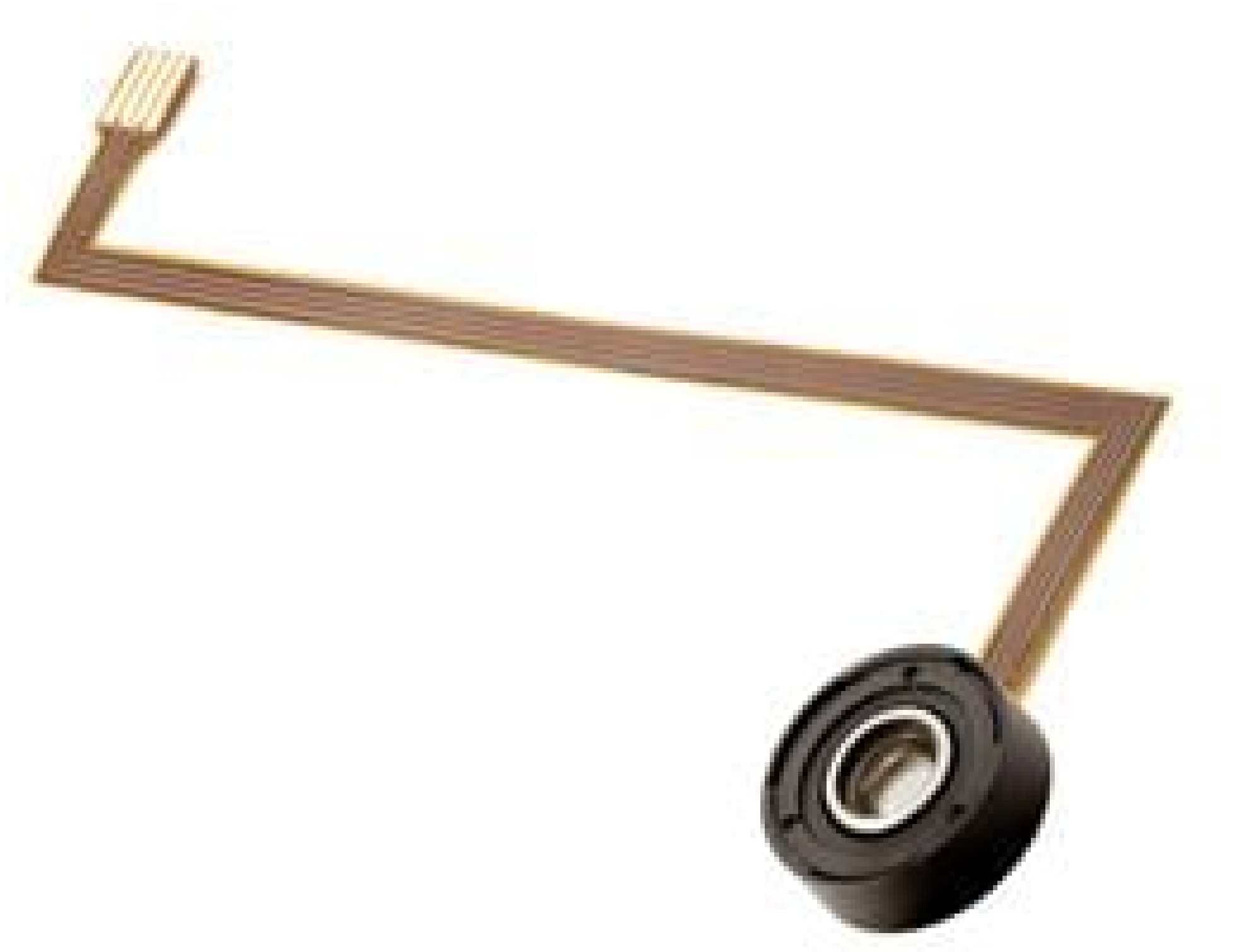
3.9mm CA, A-39N0-P04 Corning® Varioptic® Variable Focus Liquid Lens, Packaged A-Series