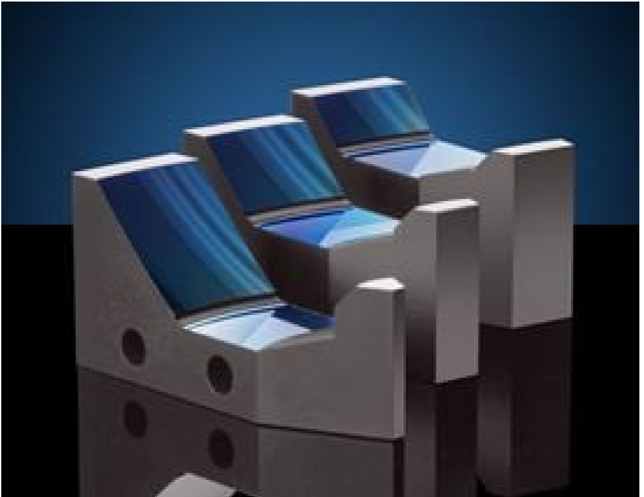
TECHSPEC® Canopus™ Reflective Beam Expanders