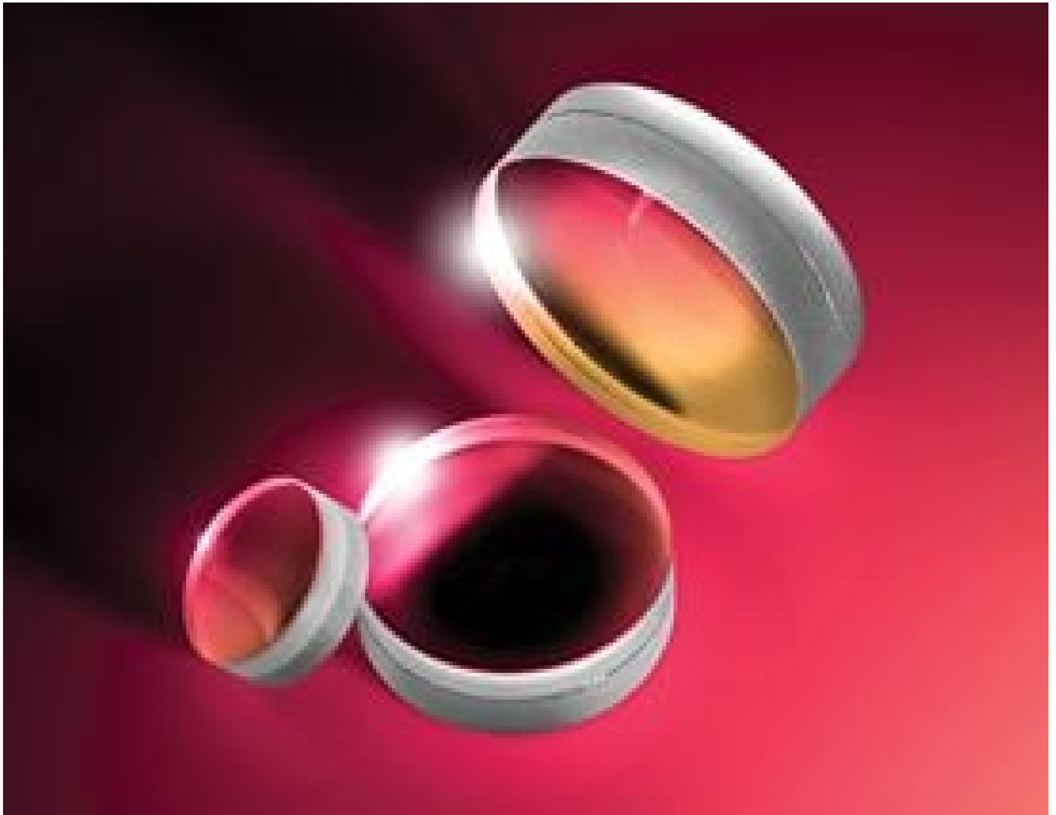
YAG-BBAR Coated Achromatic Lenses