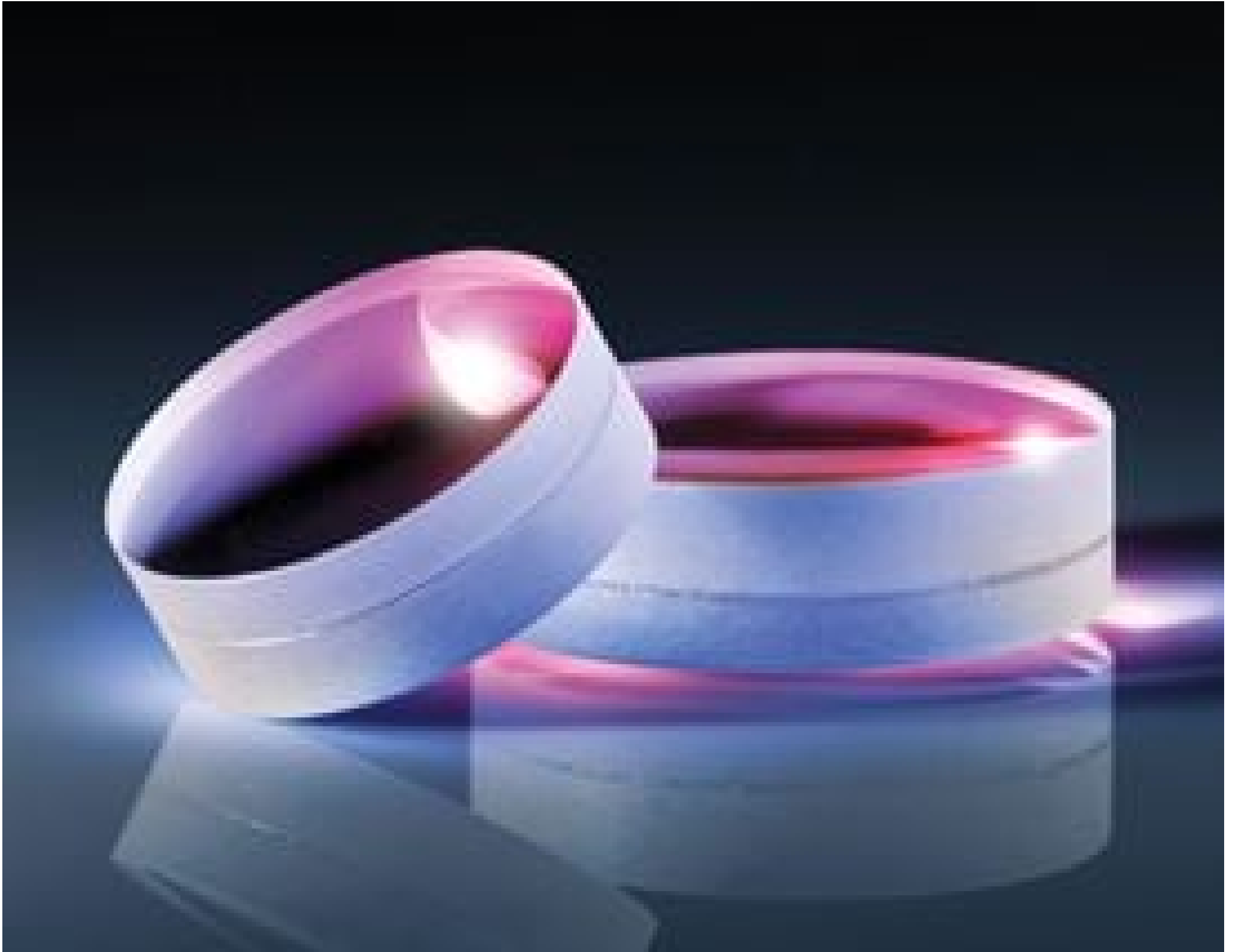
MgF 2 Coated Achromatic Lenses