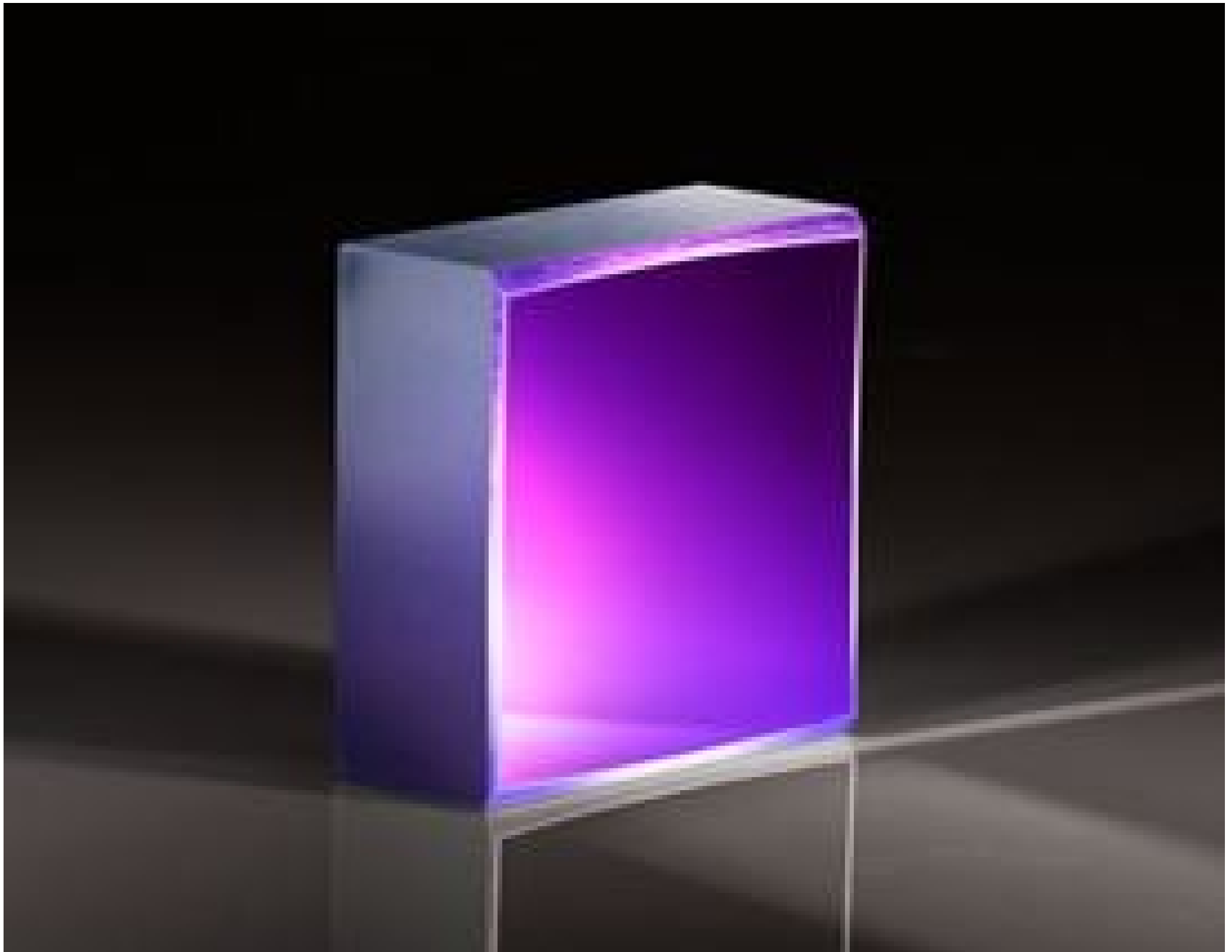
High Performance Off-Axis Parabolic Mirrors