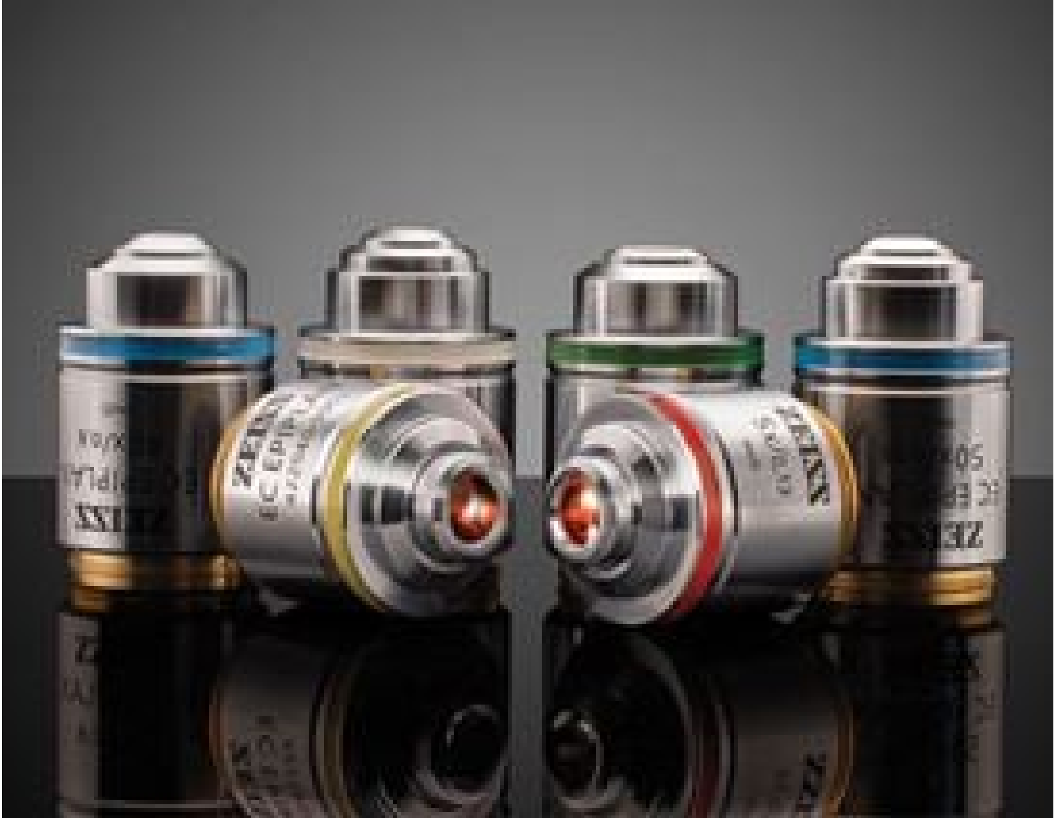
ZEISS EC Epiplan Objectives