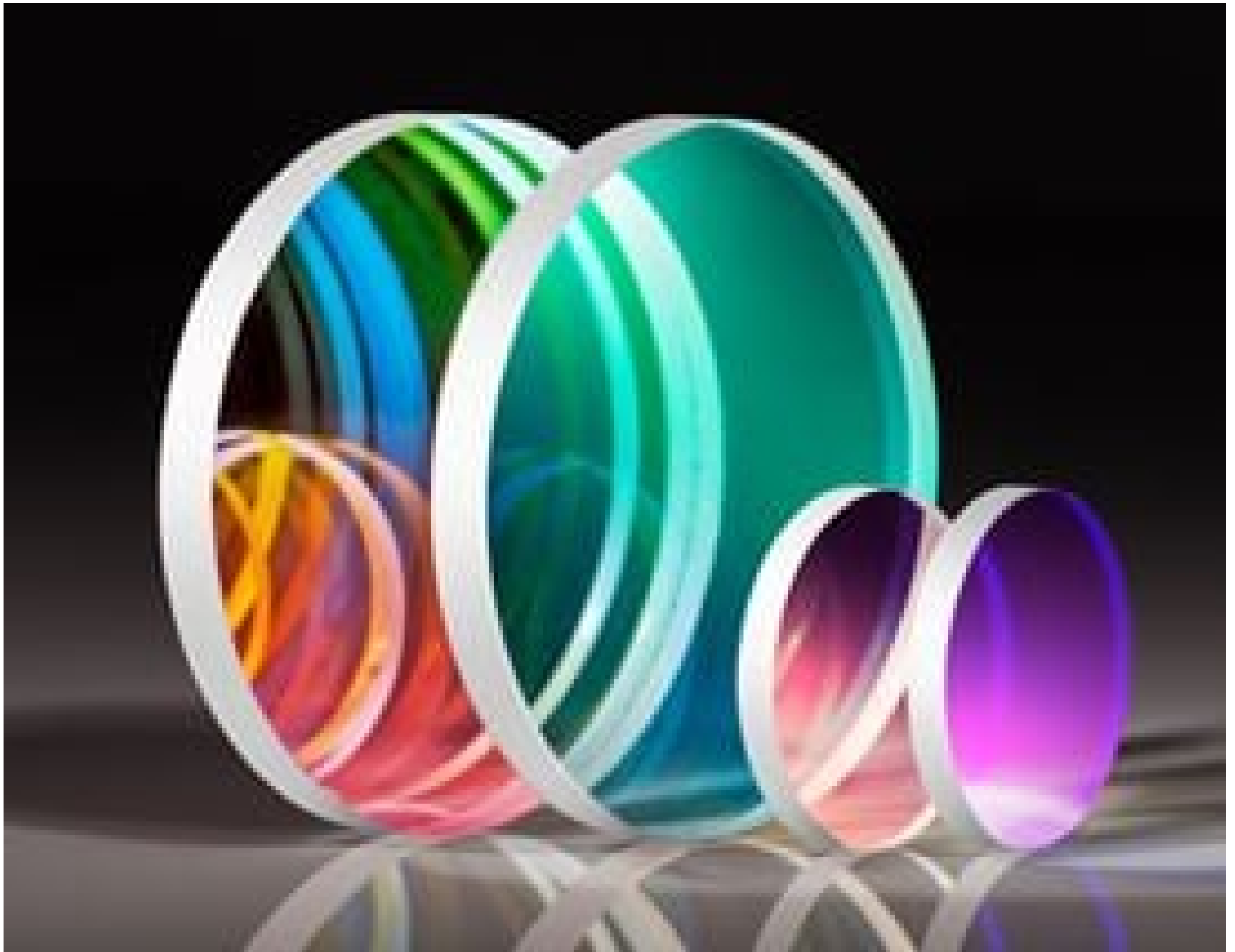
High Performance OD 4.0 Shortpass Filters