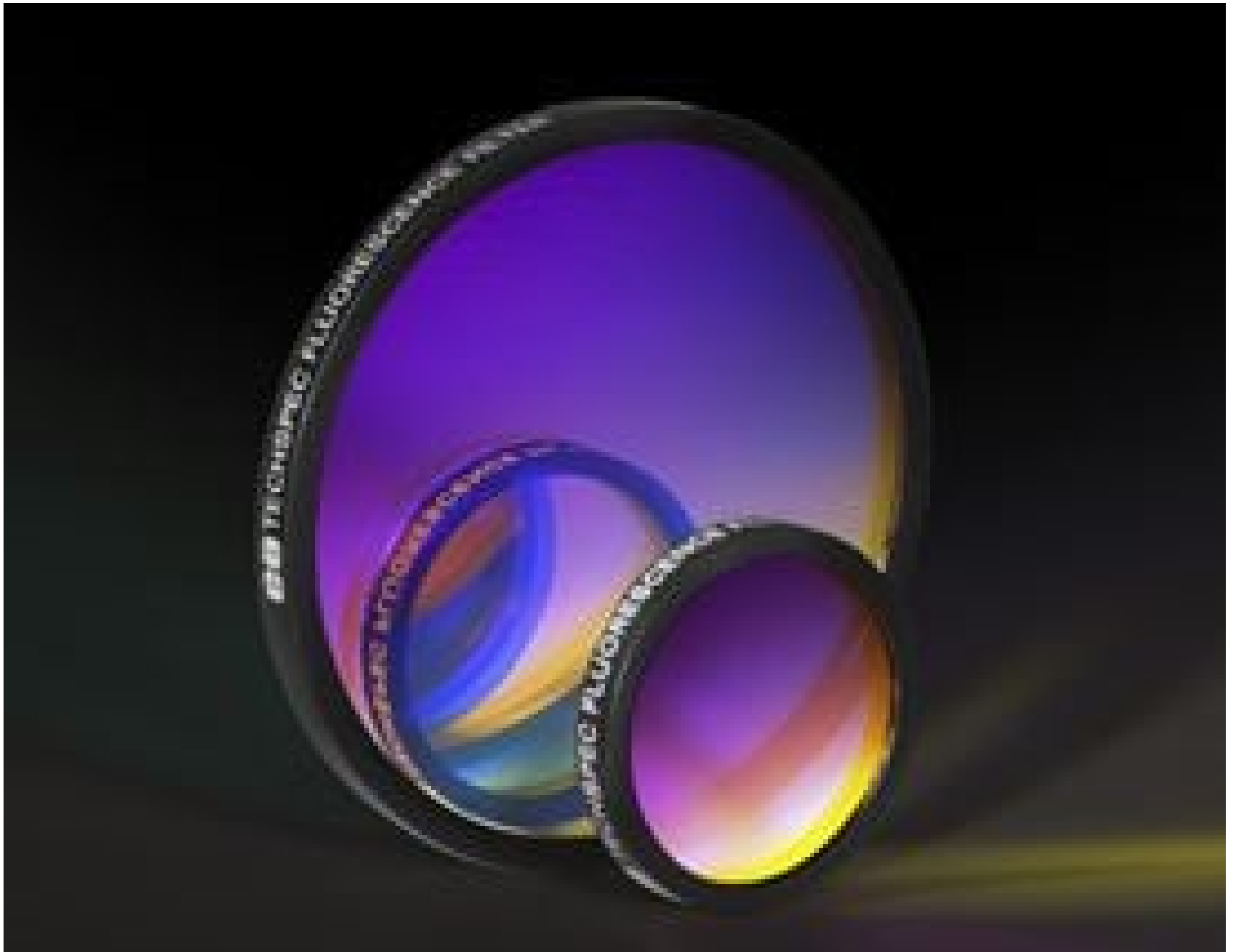
Multi-Band Fluorescence Bandpass Filters