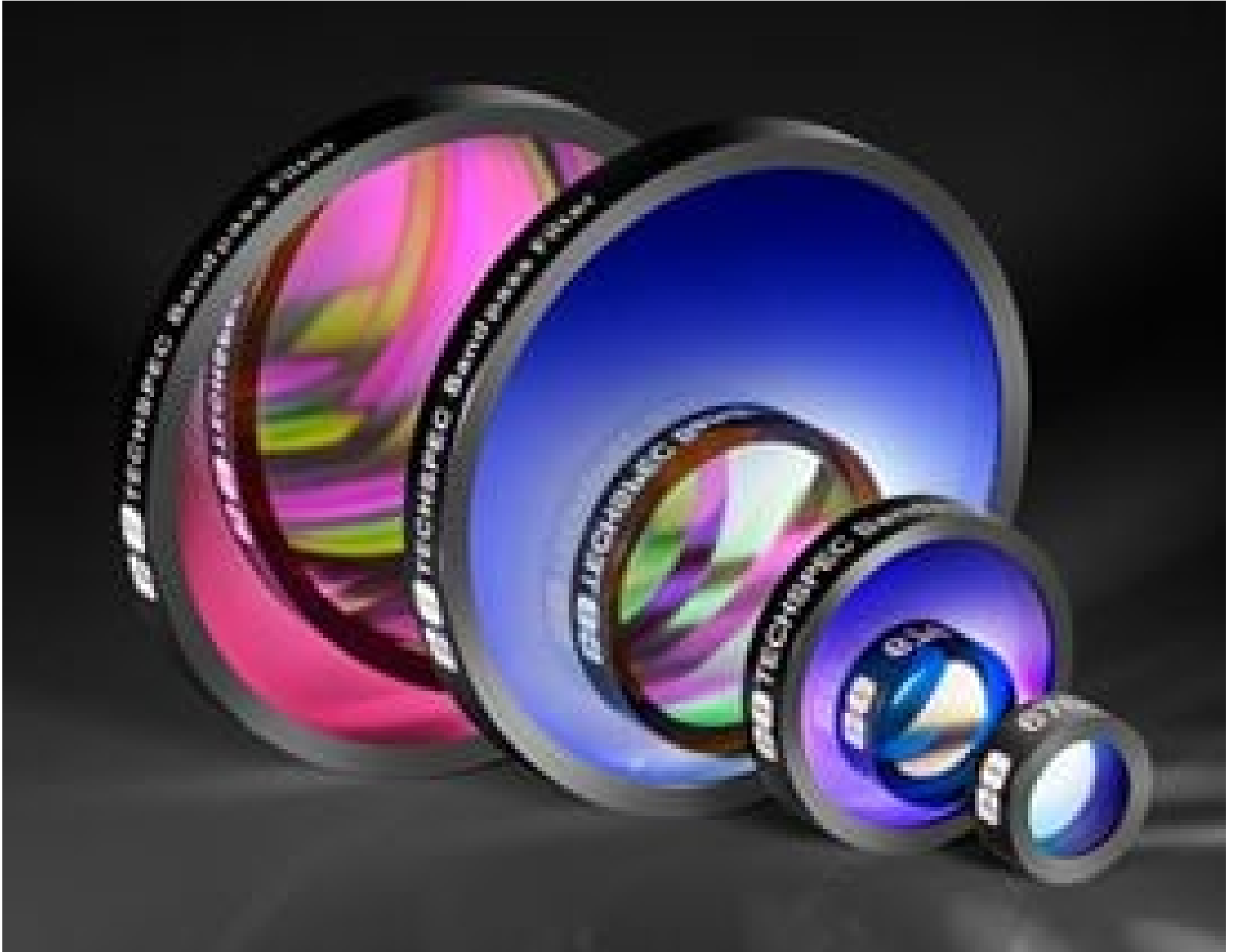
TECHSPEC Hard Coated OD 4.0 10nm Bandpass Filters