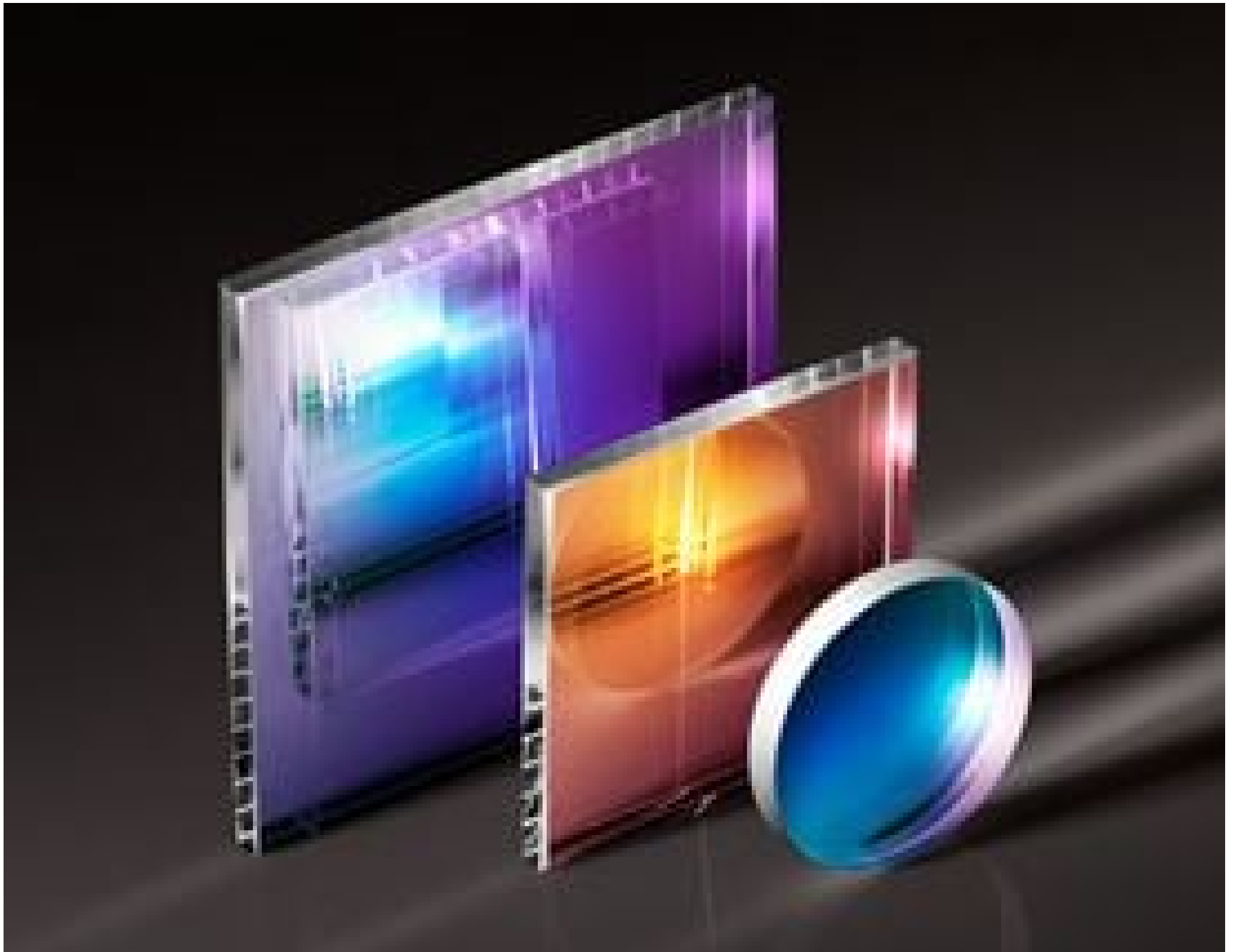
TECHSPEC High Performance Cold Mirrors