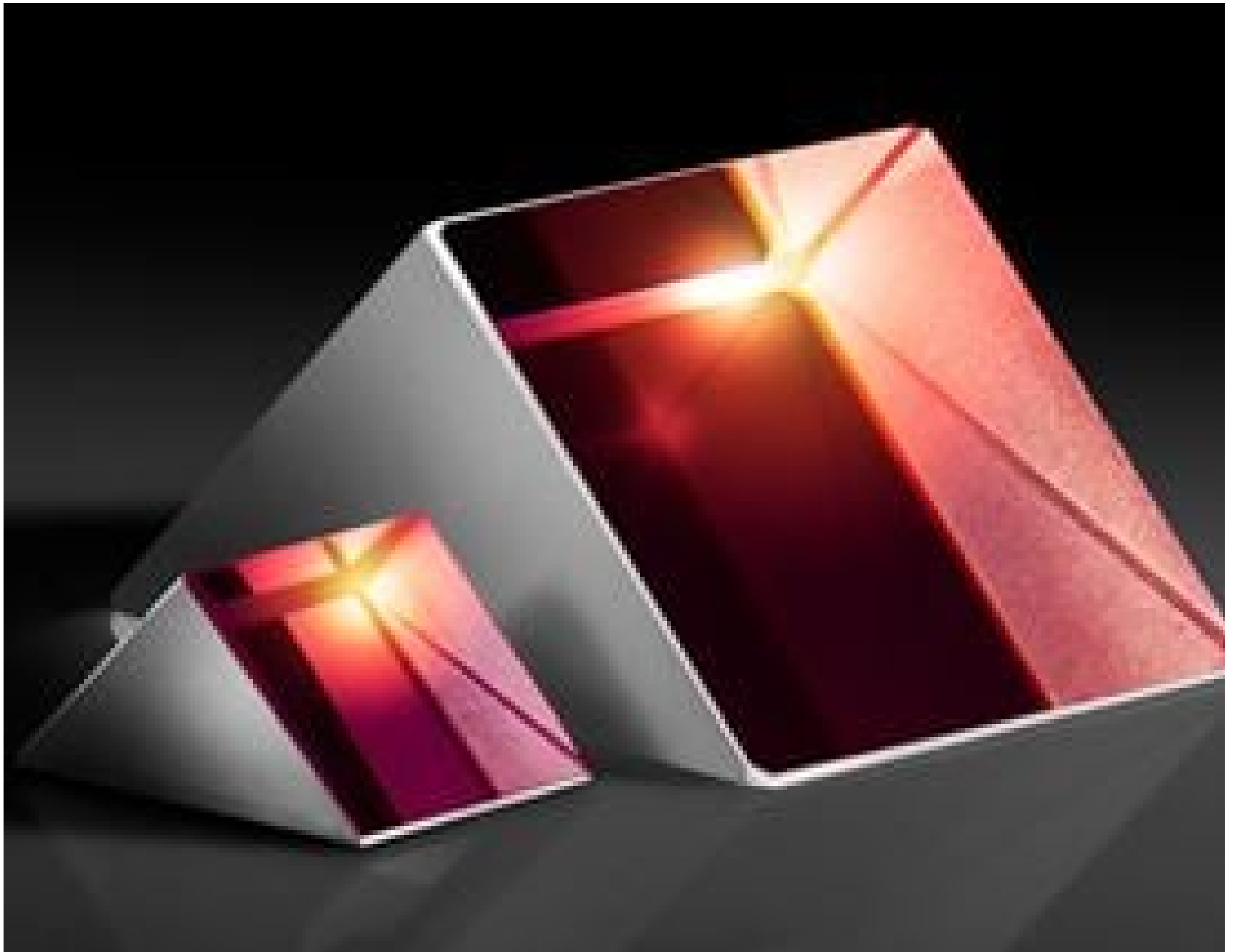
N-SF11 Right Angle Prisms