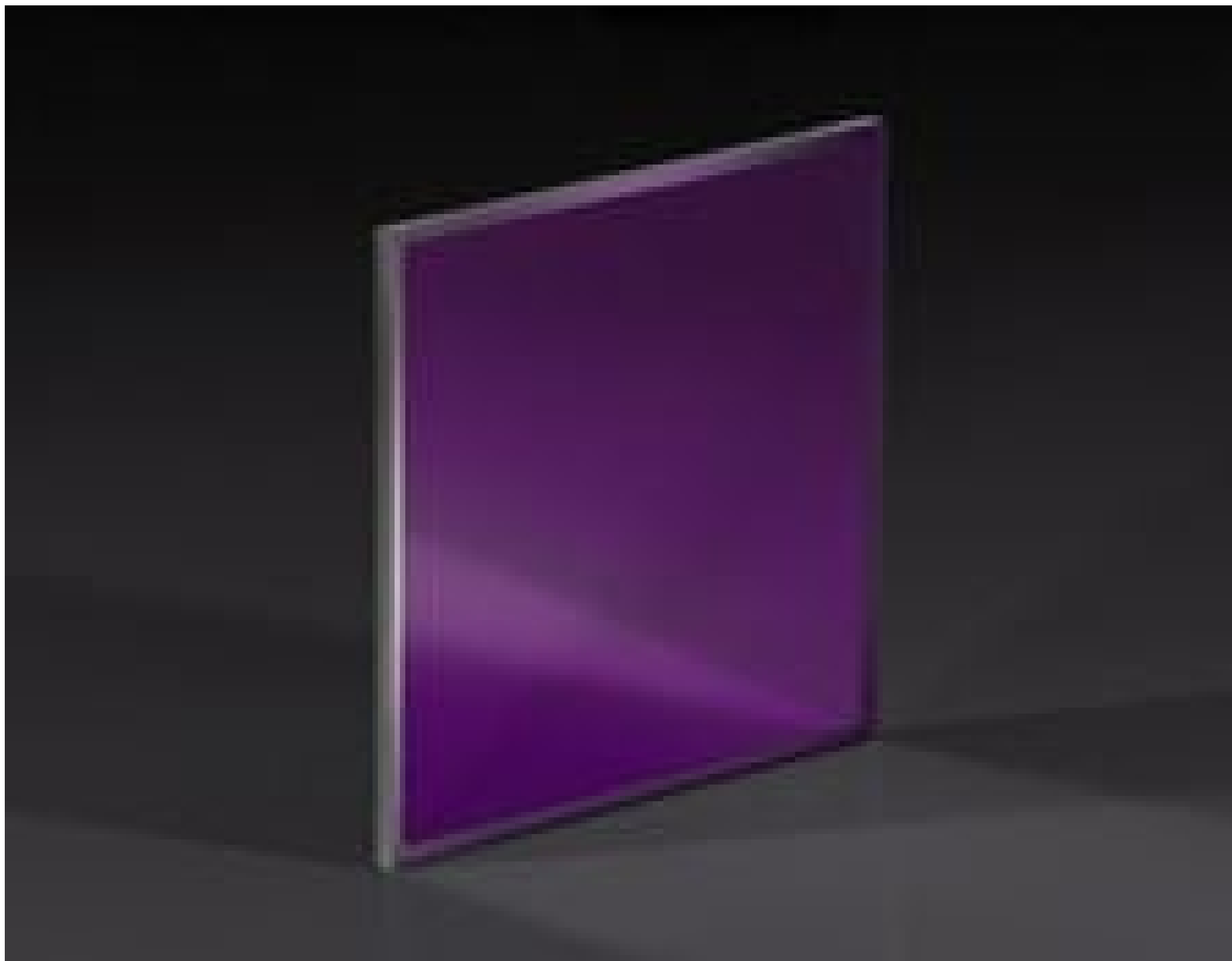
Unmounted Ultra Broadband Wire Grid Linear Polarizer