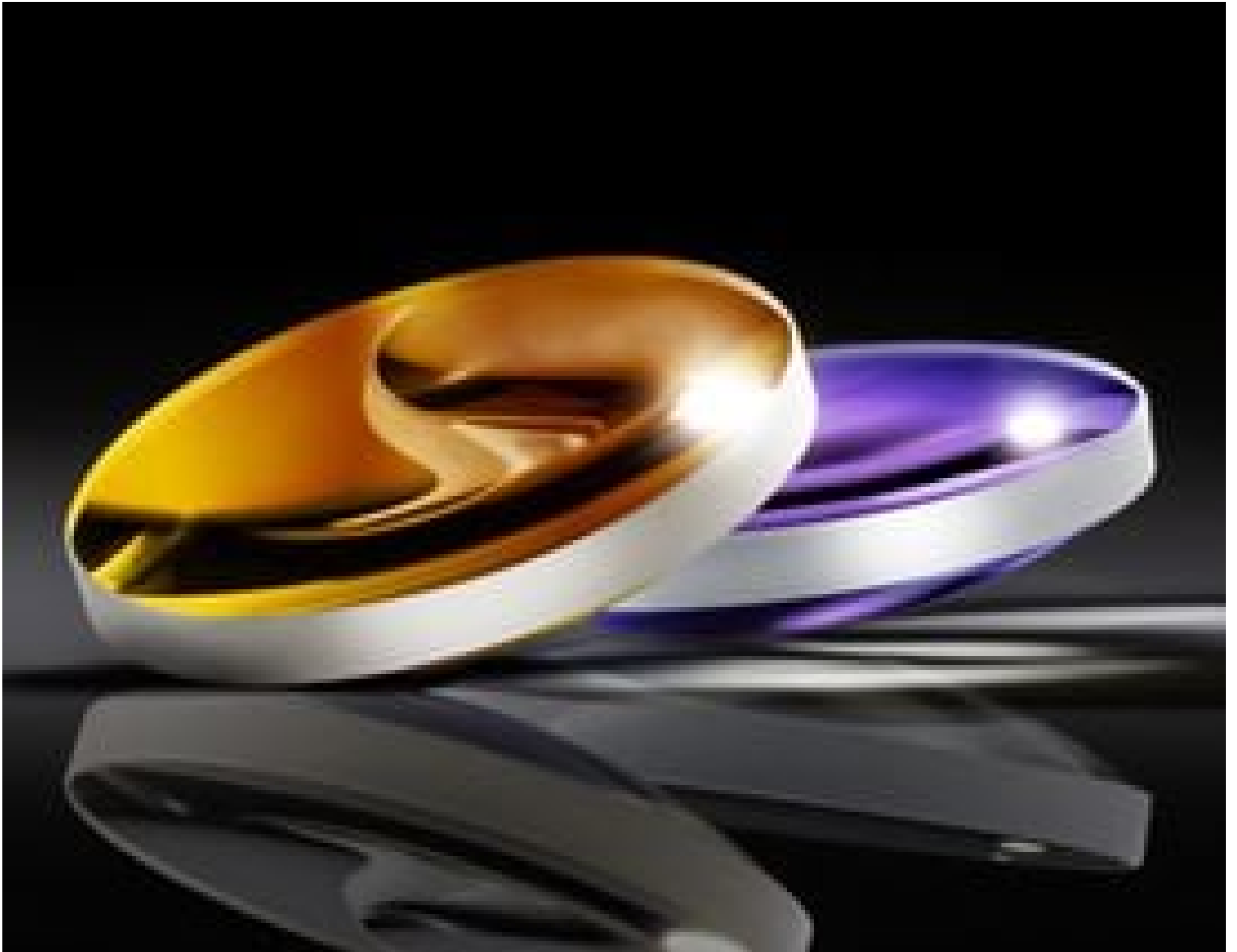
High Precision Laser Grade Aspheric Lenses