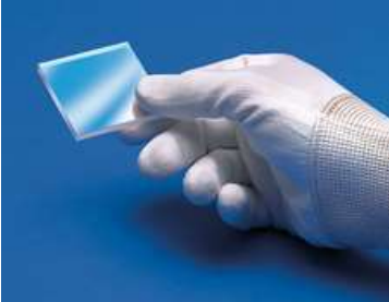
Werkzeuge zur Handhabung von Komponenten

Diese Optiken erfordern eine spezielle Behandlung, um Schäden zu vermeiden und eine lange Lebensdauer zu garantieren. Eine korrekte Handhabung, Reinigung und Lagerung sind für die optische Qualität extrem wichtig. In unserem Wissens-Zentrum finden Sie eine Schritt-für-Schritt-Anleitung zur Optikreinigung und Erklärungen zu bewährten Verfahren. Wenn Sie weitere Unterstützung benötigen, senden Sie uns gerne jederzeit eine E-Mail oder chatten Sie mit unserem technischen Support.