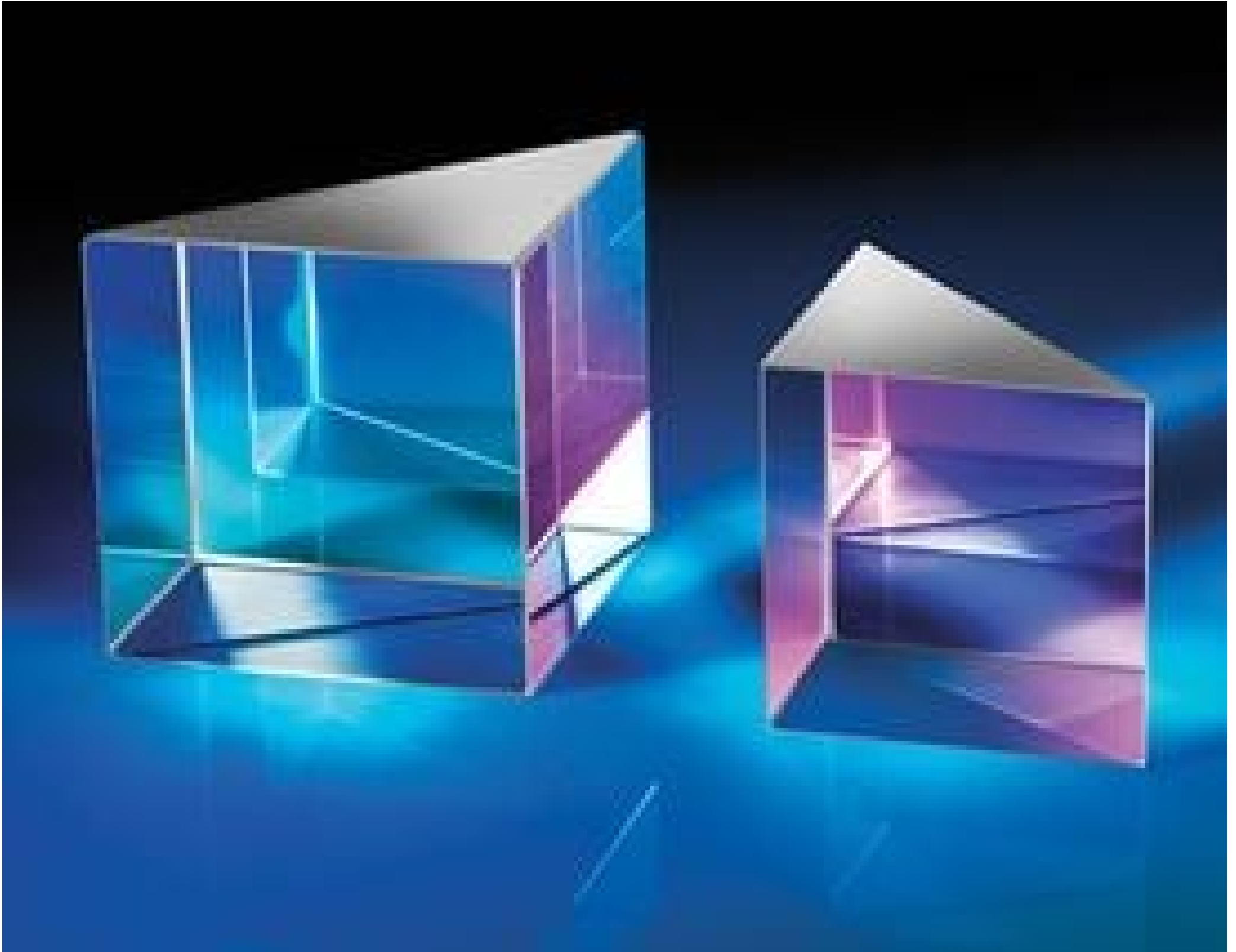
N-BK7 High Tolerance Right Angle Prisms