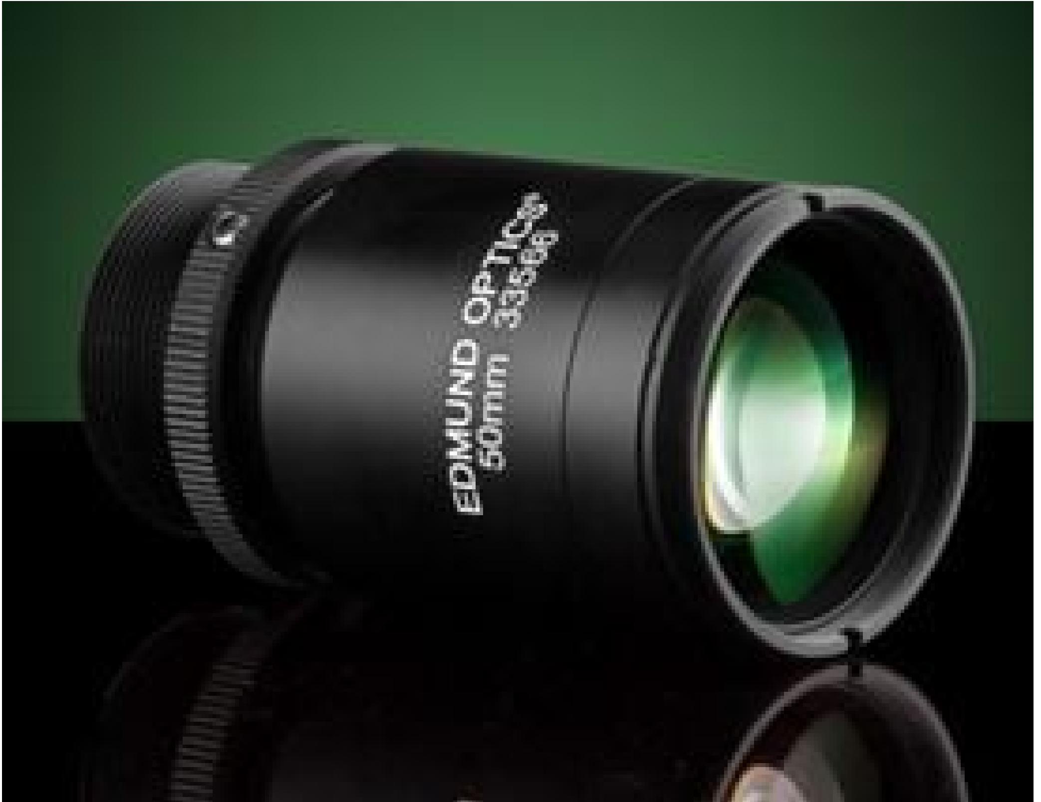
50mm CxSeries Fixed Focal Length Lens, #33-566