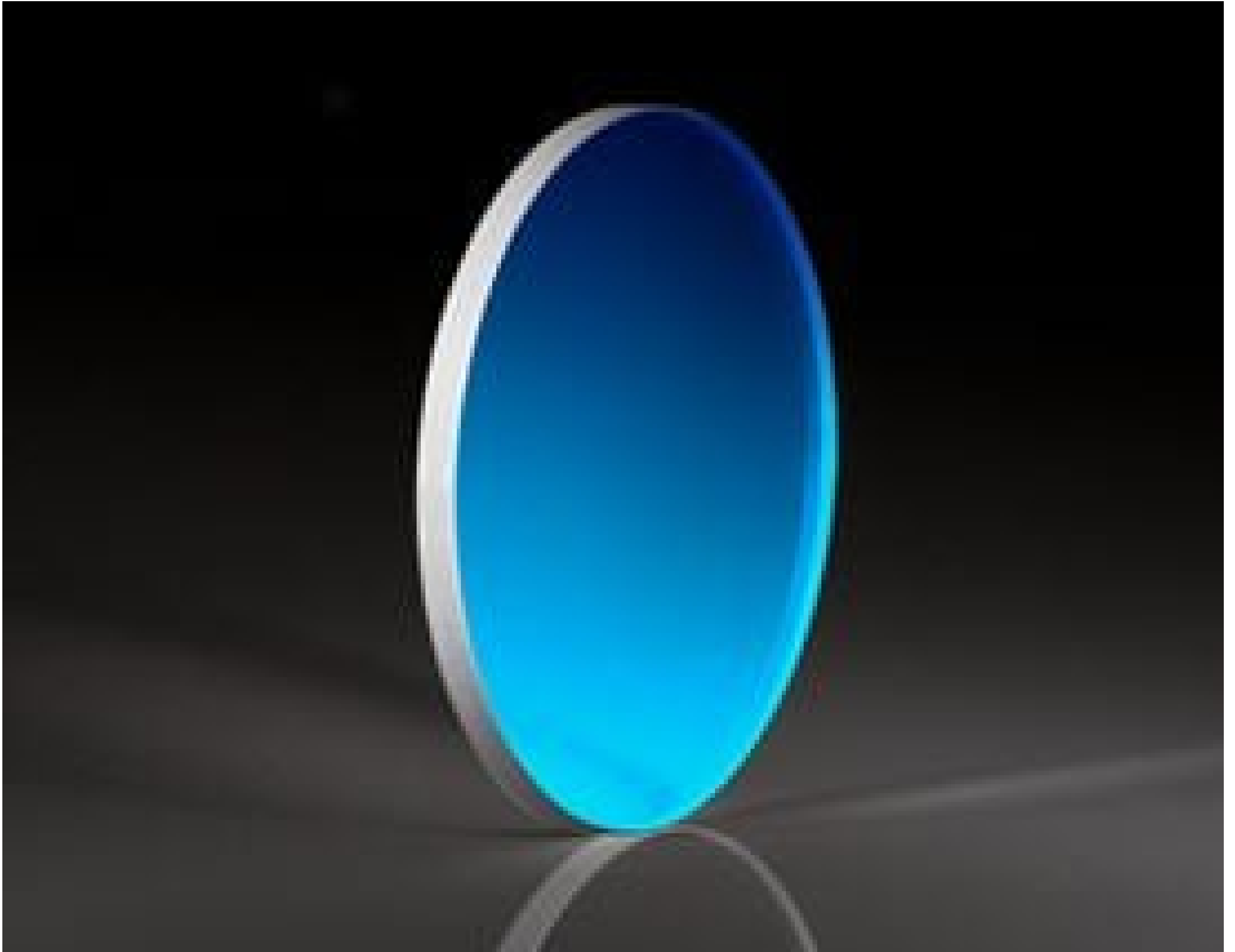
Uncoated \lambda/20 Fused Silica Window