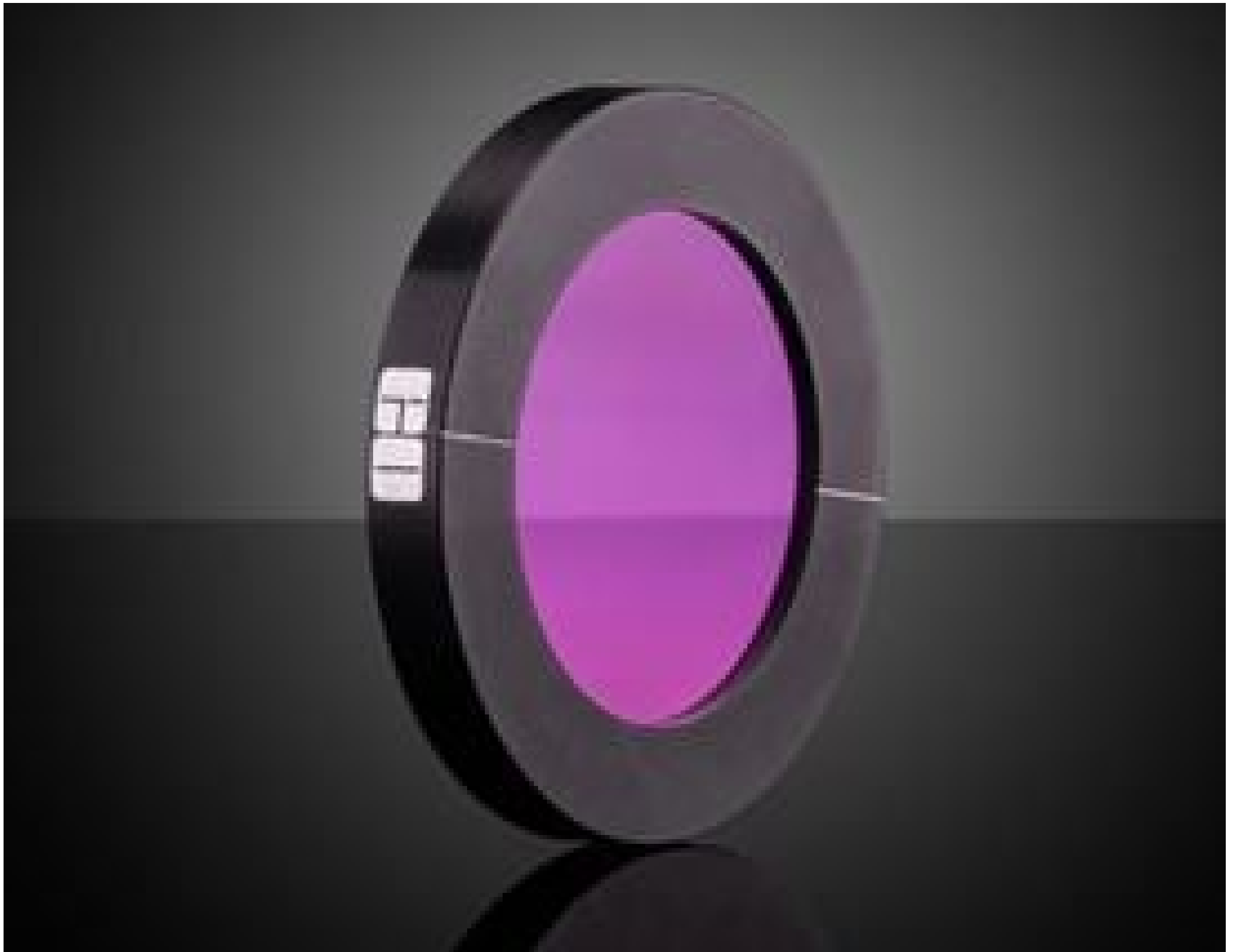
50mm Dia. BaF 2 IR Holographic Wire Grid Polarizer, #62-771