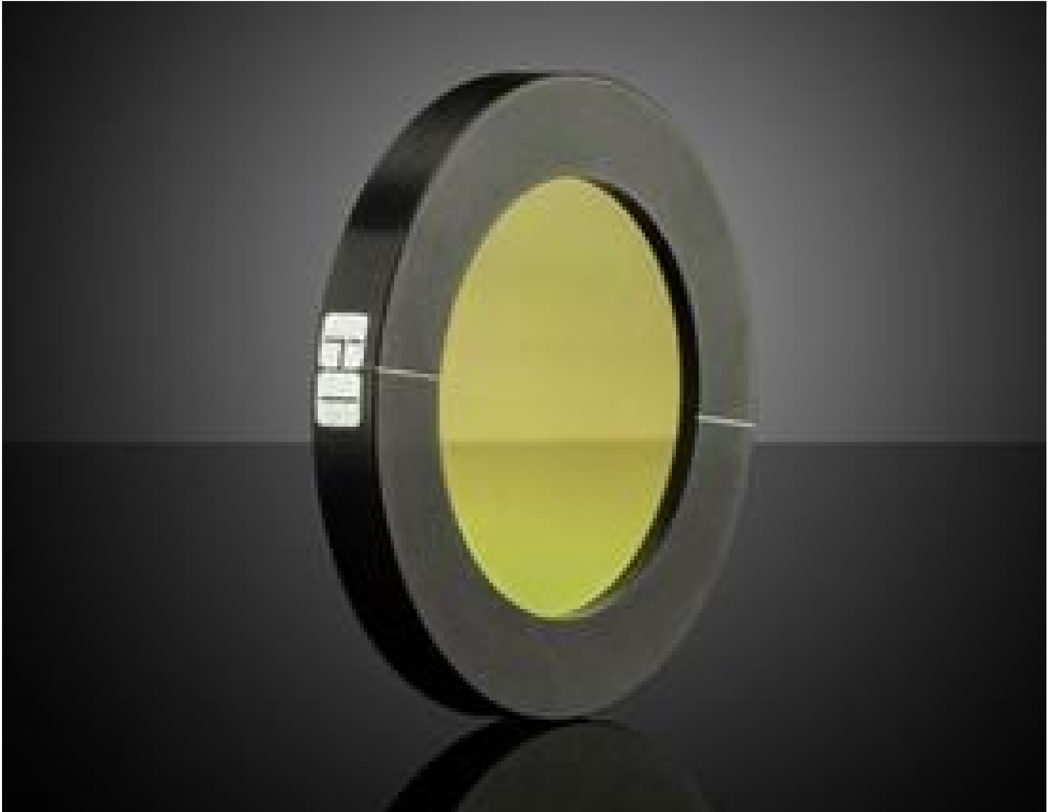
50mm Dia. KRS-5, IR Holographic Wire Grid Polarizer, #62-775