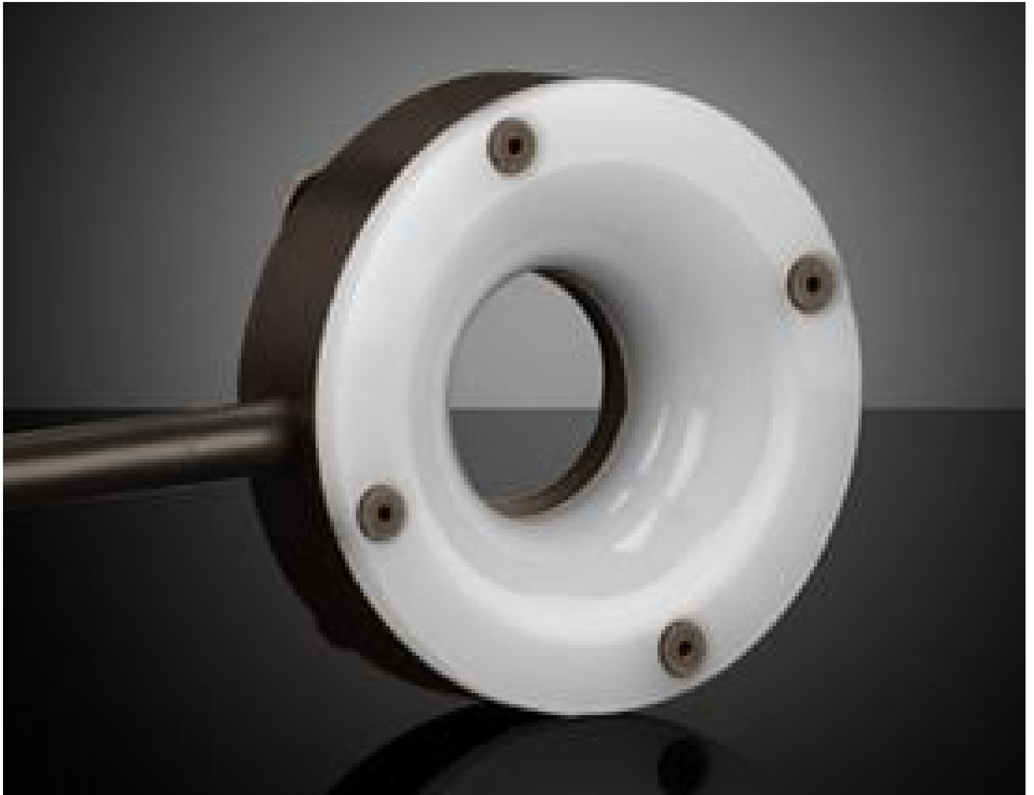
Advanced Illumination MicroBrite Diffuse Darkfield Ring Lights

Produkt #18-558-RCD-05P REZERTIFIZIERT 1 In Stock