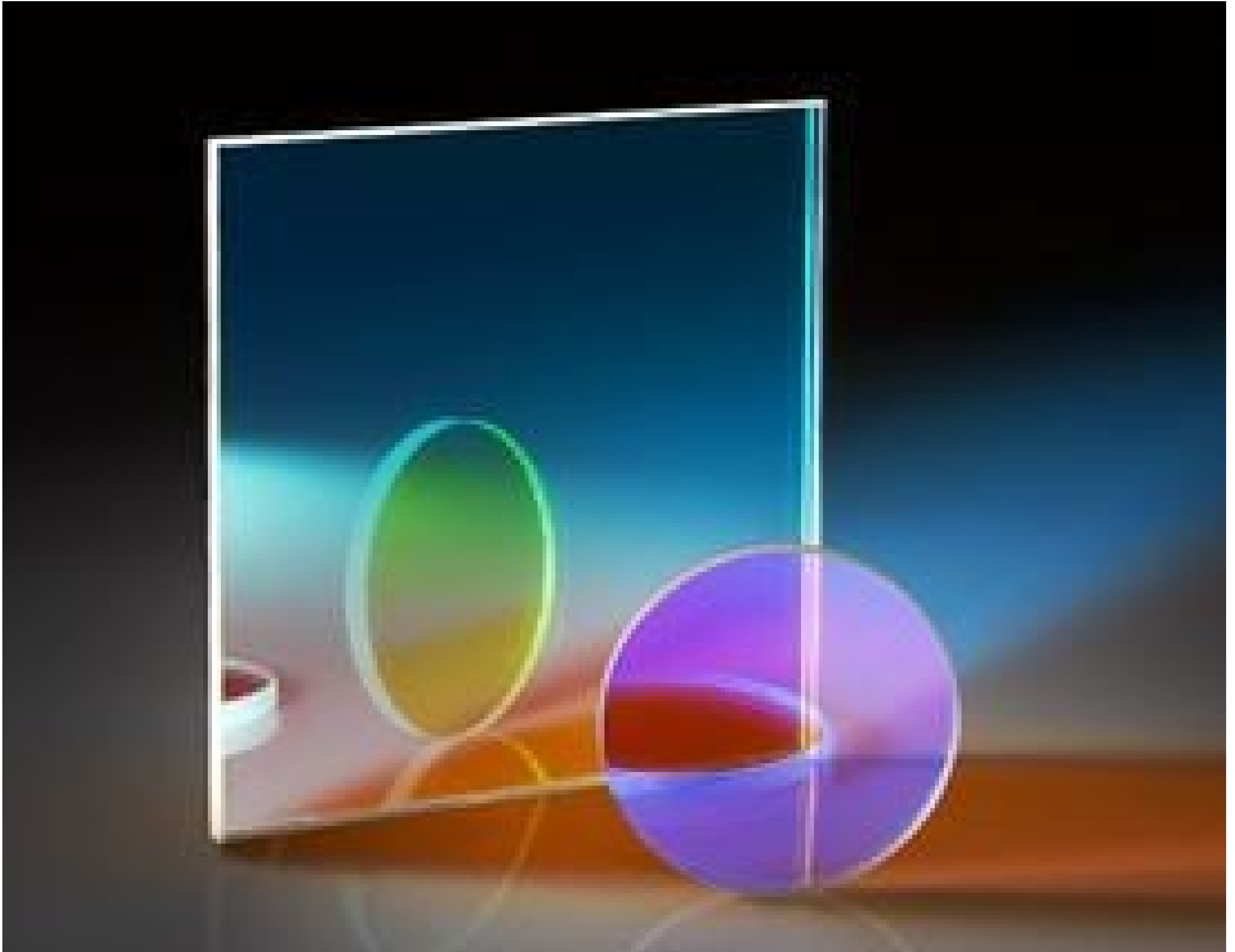
Additive and Subtractive Dichroic Color Filters