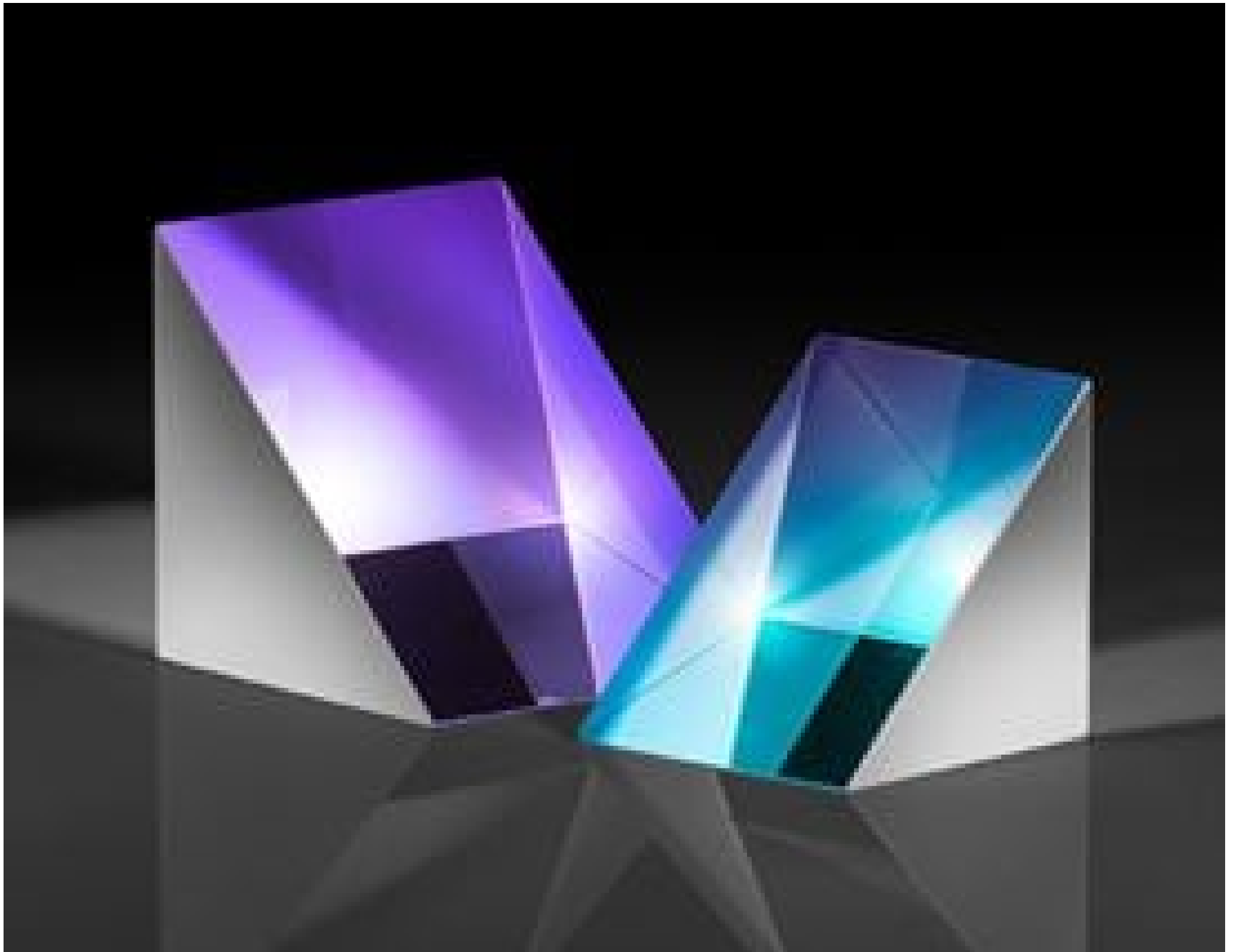
N-BK7 Right Angle Prisms