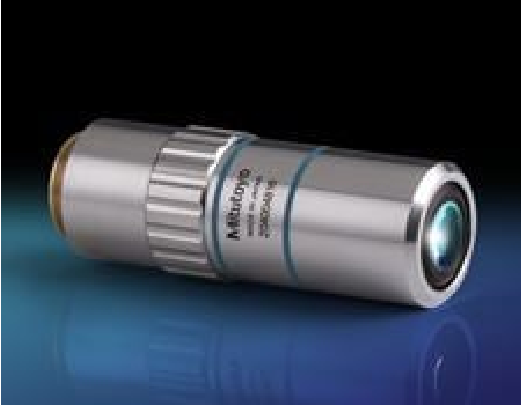
50X Mitutoyo Plan Apo HR Infinity Corrected Objective, #58-237