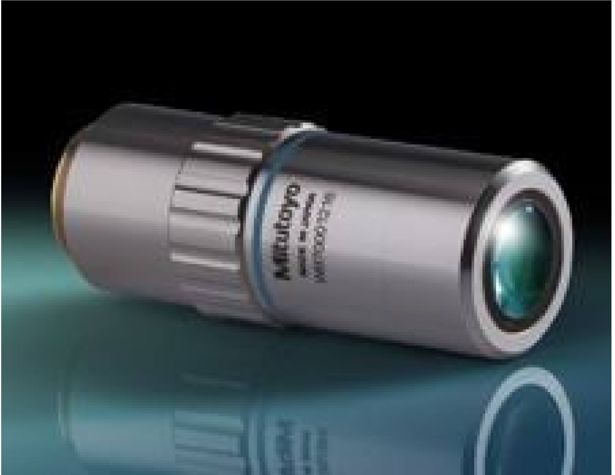
50X Mitutoyo Plan Apo Infinity Corrected Long WD Objective, #46-146