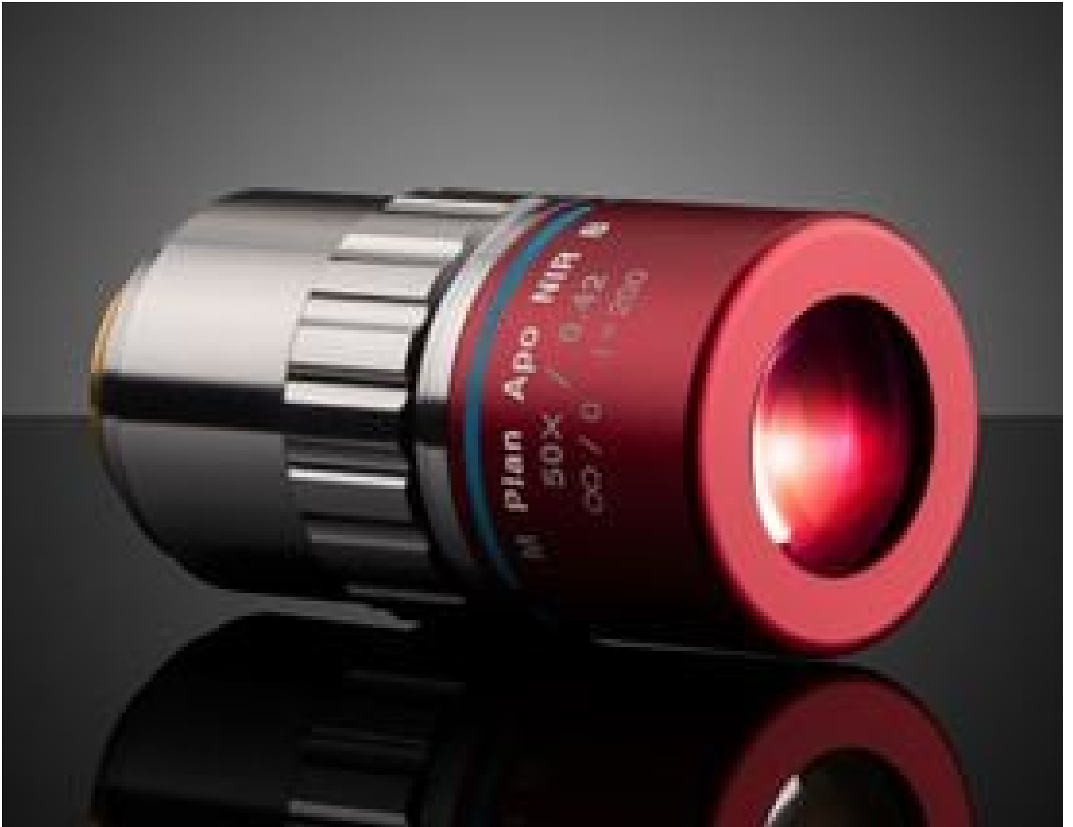
50X Mitutoyo Plan Apo NIR B Infinity Corrected Objective, #89-351