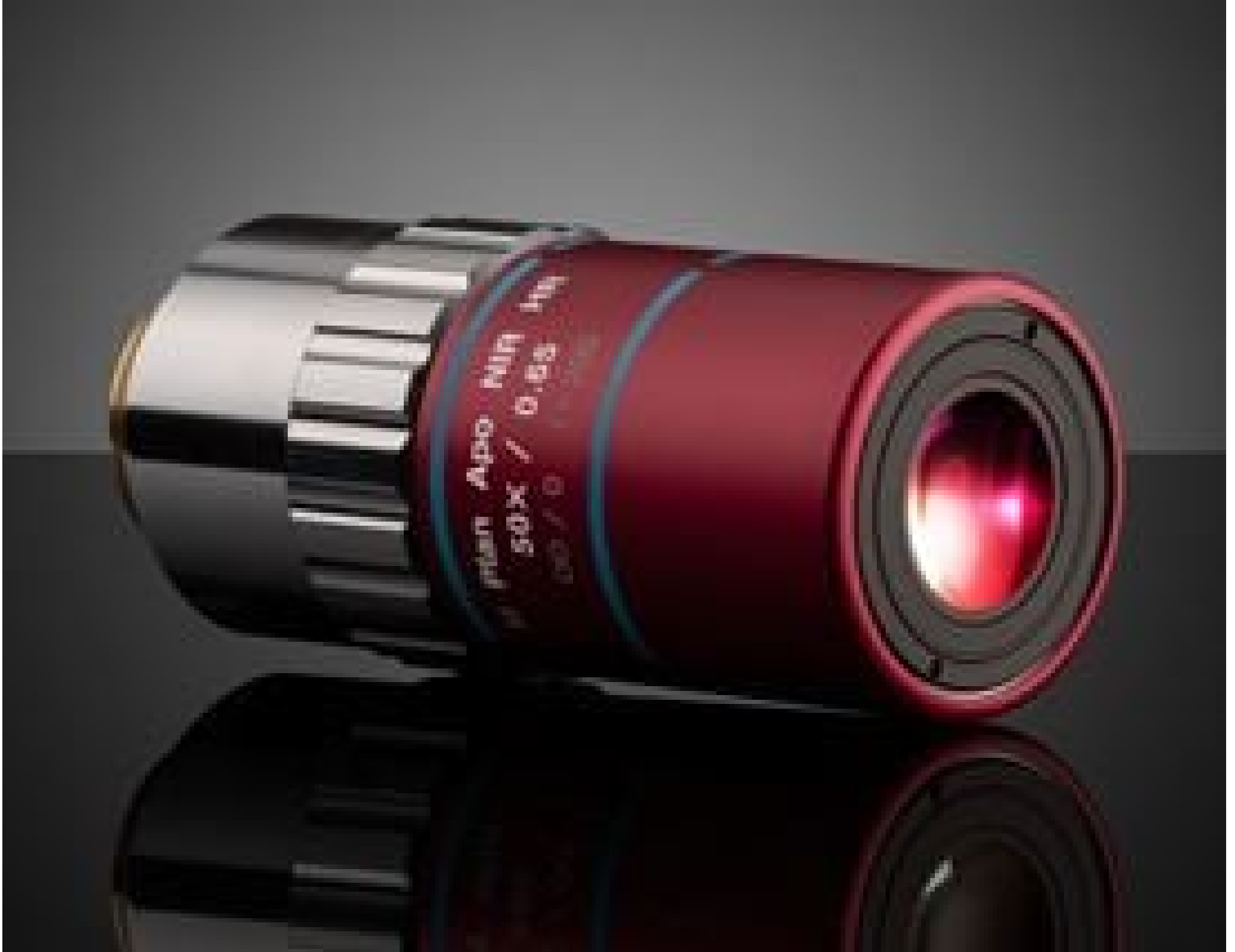
50X Mitutoyo Plan Apo NIR HR Infinity Corrected Objective, #56-982